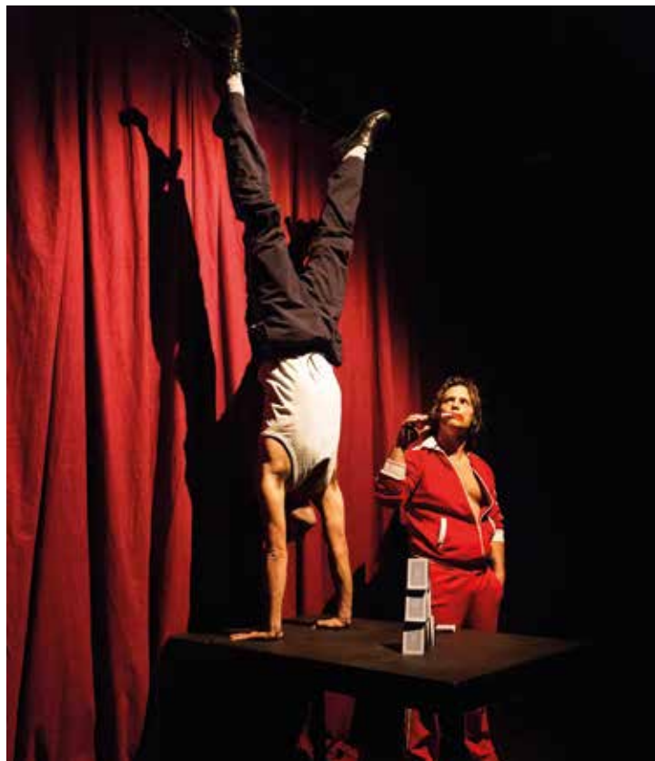
'Ye orbayu...', espectacle de circ i humor, el 16 de desembre.

L'equipament també acollirà El ballet del Trencanous , que representarà els dies 29 (20.30 h) i 30 de desembre (19.30 h) l'Associació Juvenil de Dansa del Masnou.