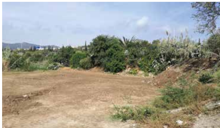
S'ha netejat l'abocador situat a la part alta del parc de Vallmora.

La Comissió de Civisme es va iniciar el setembre del 2017 i està formada per representants de totes les entitats veïnals del Masnou; de la Federació del Comerç, la Indústria i el Turisme; persones a títol individual, i membres de l'Equip de Govern de l'Ajuntament. ■