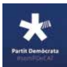
Grup Municipal Demòcrata (PDeCAT-Unió)

va fer possible la substitució del paviment de la pista al Complex Esportiu. La determinació també ha caracteritzat el treball de la gent d'ERC, i per això actualment el nostre municipi compta amb recursos i serveis de professionals que treballen per impulsar polítiques de salut mental, com el Centre de Salut Mental Infantil i Juvenil (CSMIJ), el d'Atenció i Seguiment de Drogodependències (CAS) i és el referent en el Baix Maresme del Centre de Desenvolupament Infantil i Atenció Precoç (CDIAP). Molta feina, i moltes ganes encara d'encarar nous projectes, perquè sols qui viu i trepitja el municipi i parla amb els veïns té la certesa d'estar treballant per un Masnou millor, i no saltres la tenim, i de ganes no ens en falten. Continuarem amb la mateixa determinació el proper any, i des d'aquí us desitgem bones festes i bon any 2019!