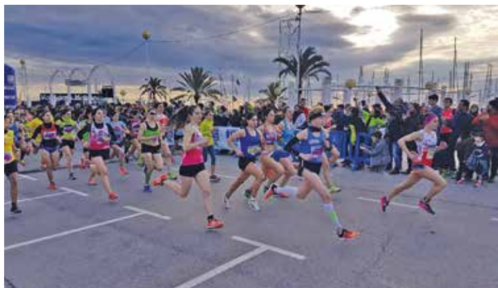
La cursa de Sant Silvestre tindrà lloc el 26 de desembre. LA SANSI

Tot i que ja més allunyat de les festes nadalenques, el col·lectiu LACAM no faltará a la seva cita anual amb el Circ d'Hivern , els dies 12 de gener (a les 20 h) i 13 (a les 19 h).