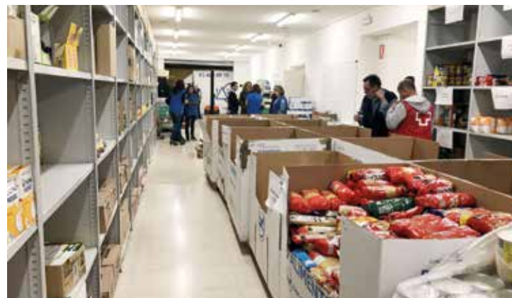
Més de 30 tones de menjar es van recollir al Gran Recapte d'Aliments. MIREIA CUXART

Marató, al davant de l'edifici de Roger de Flor. A partir de les 11 h i fins a les 21 h hi haurà diferents activitats promogudes per entitats del Masnou que col·laboraran en aquesta causa a través de tallers, actuacions, xocolatada i d'altres activitats. A aquesta cita va lligada la carismàtica i col·laborativa sopa de pedres. Gràcies a les aportacions de vilatans i vilatanes i dels establiments del poble, es recapten prou aliments per preparar una olla de caldo que es repartirà a partir de les 19.30 h entre les persones assistents.