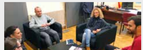
Els joves van ser rebuts per l'alcalde i la regidora de Promoció Econòmica. MIREIA CUXART

nançament del Fons Social Europeu des de la Iniciativa d'Ocupació Juvenil. També des de l'octubre, tres alumnes de l'Institut Maremar realitzen les pràctiques de l'FP dual a l'Ajuntament. Completen així els seus estudis del Cicle Formatiu de Grau Superior d'Integració Social amb formació dual. Una de les alumnes realitza les pràctiques al Servei Bàsic d'Atenció Social (SBAS). La segona, al Servei Local d'Ocupació. El tercer, a la Regidoria d'Acció Social, formant-se i treballant en dos serveis: al Centre de Distribució d'Aliments (CDA) i a l'Equip Bàsic d'Atenció Social (EBAS).