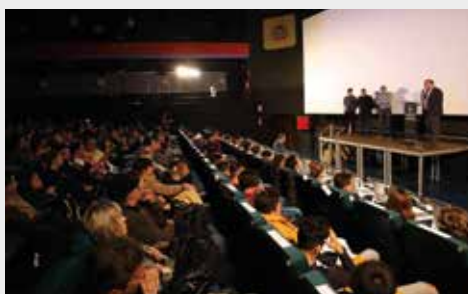
El cinema es va omplir de gom a gom.