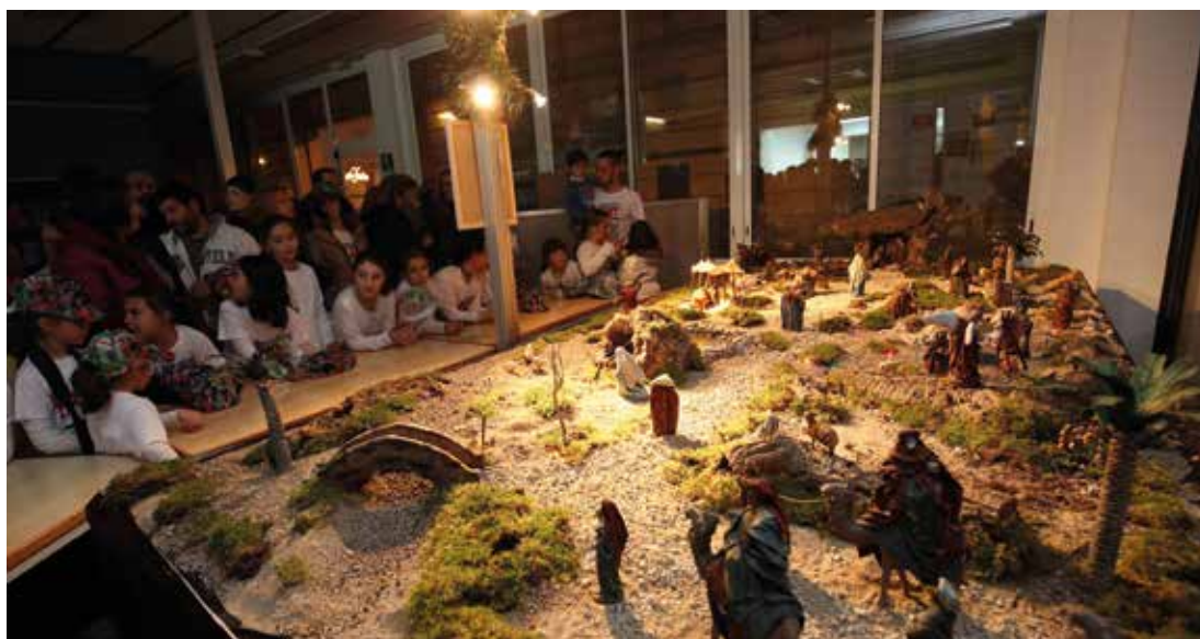
El pessebre municipal es podrà veure fins al 7 de gener a Els Vienesos. RAMON BOADELLA

la Cursa de Sant Silvestre masnovina és l'única per a dones del calendari espanyol i, a més de les curses per a adults, inclou curses per a menors. Les inscripcions romandran obertes mentre quedin dorsals. Es poden fer en línia a la pàgina web: www.santsilvestredelmasnou.com . Com els darrers anys, les entitats i els centres educatius del Masnou que hi vulguin participar i facin més de deu inscripcions gaudiran d'un preu especial. Per a més informació, podeu contactar amb la Regidoria d'Esports a: esports@elmasnou.cat . ■