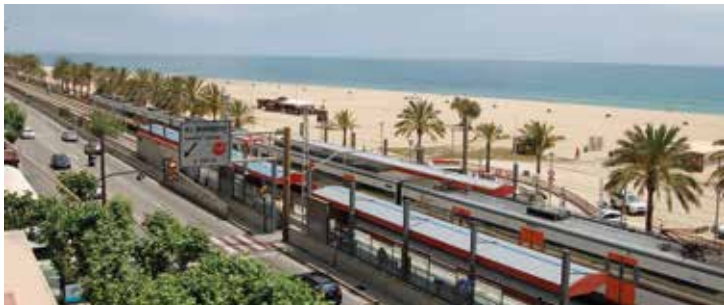
Prop de 3 milions d'euros es destinaran a la remodelació. DOMÈNEC CANO

Llum verda a l'actuació per millorar-ne l'accessibilitat