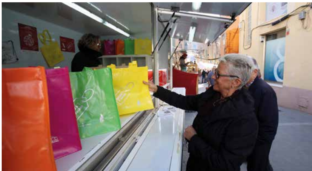
La campanya obsequia els participants amb bosses de compra reutilitzables. RAMON BOADELLA