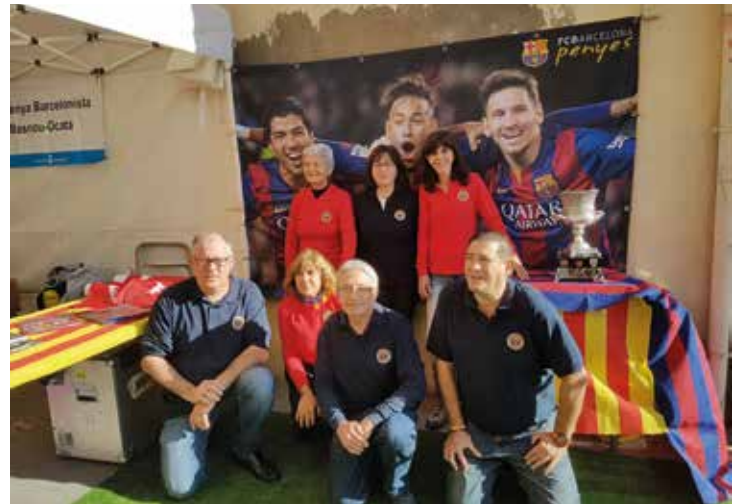
La Penya Barcelonista va participar en la darrera edició de la Fira d'Entitats.

Però més enllà de les activitats i iniciatives que tenen a veure amb el Barça, la gent que forma part de la Penya dedica part del seu temps a col·laborar amb altres entitats per tirar endavant actes solidaris al municipi. N'és un bon exemple el torneig de pàdel que organitza la Penya en col·laboració amb altres entitats i institucions i a favor de l'Associació Prodisminuïts Psíquics del Masnou (DISMA) i d'aquest col·lectiu.