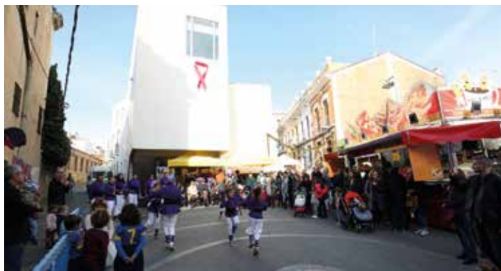
Activitats i actuacions van complementar la Fira de Nadal. RAMON BOADELLA

establiments del municipi que justifiqui la despesa realitzada rebrà com a obsequi una bossa de disseny, fins a exhaurir-ne les existències. La butlleta, servirà