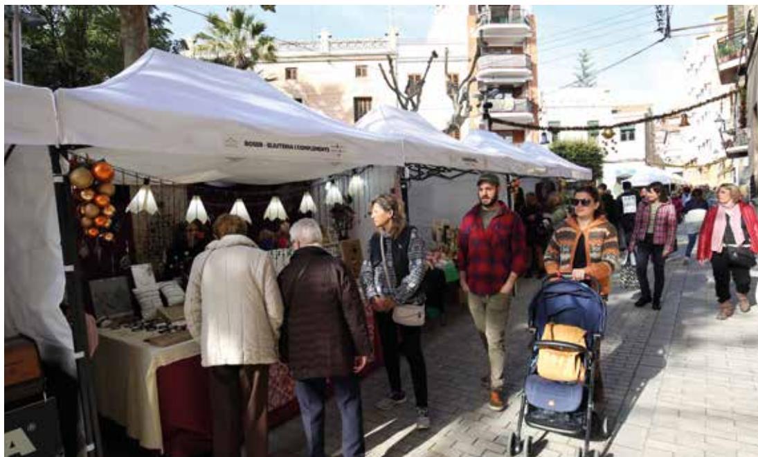
La Fira de Nadal es va instal·lar al recentment reurbanitzat carrer de Roger de Flor. RAMON BOADELLA

Es dona el tret de sortida a les activitats nadalenques del municipi