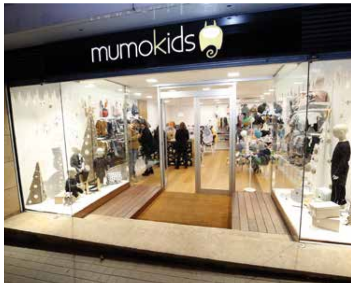
Aparador de Mumokids. RAMON BOADELLA

Amb l'aparador de Nadal van voler transmetre que són un establiment ecofriendly , amb productes de qualitat i respectuosos amb el medi ambient. Per això, van utilitzar cartró i van dissenyar una estàtica nadalenca actual, neta, on predominaven el blanc i els colors suaus.