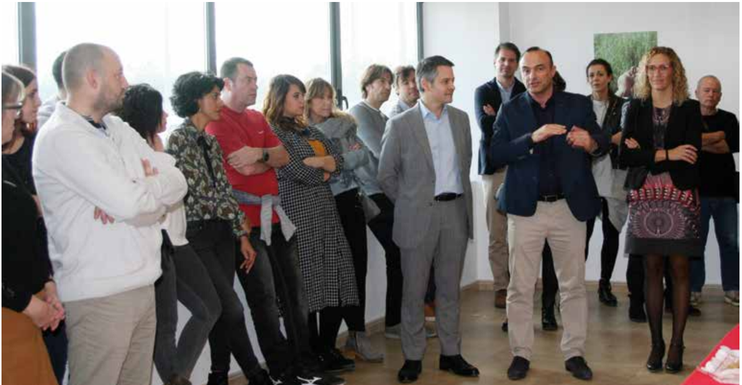
L'alcalde i la regidora de Promoció Econòmica van visitar les instal·lacions. DOMÈNEC CANO

La fàbrica agraeix la mediació de l'alcalde per propiciar que l'empresa es quedi al municipi