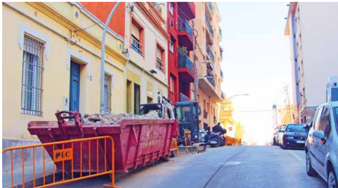
Les obres de connexió de la xarxa d'aigües Aragó són a punt de finalitzar. RAÜL ANDREU