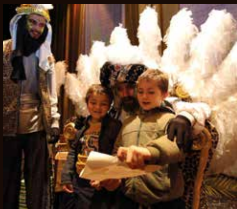
Els carters reials van recollir les cartes els dies previs a la Cavalcada.

Com van dir els Reis Mags en el seu discurs d'enguany: "La felicitat és dins vostre, dins cadascú de nosaltres, i ens agradaria poder-ne repartir una mica, per a vosaltres i per a les vostres famílies. Una felicitat que duri tot l'any, fins que ens tornem a veure l'any vinent!" ■