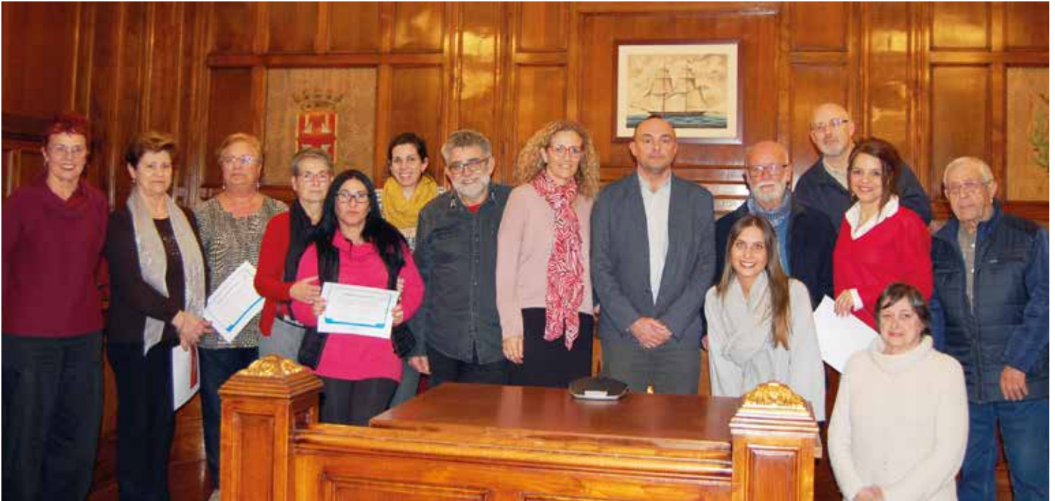
L'alcaldre i la regidora de Promoció Econòmica van entregar els premis a les persones guanyadores. MIREIA CUXART