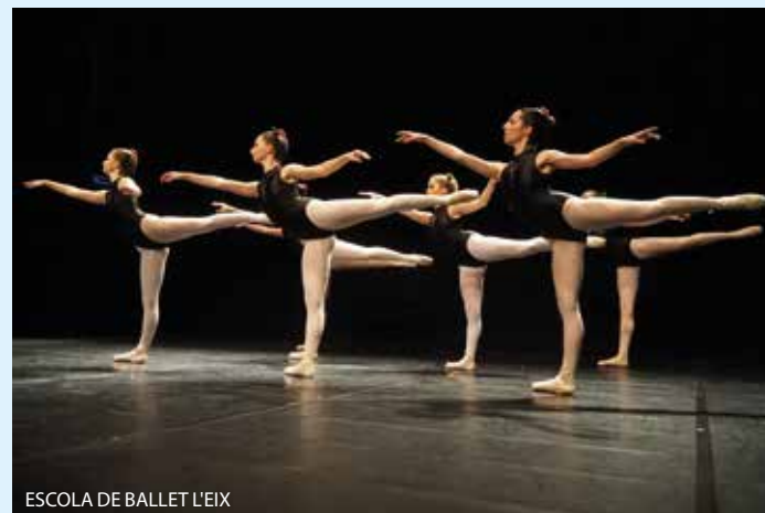
ESCOLA DE BALLE T L'EIX

L'espectacle Amb ritme de Nadal , a càrrec de l'Associació de Dansa i Teatre Musical del Masnou i l'Escola de Ballet L'Eix del Masnou.