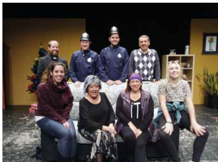
'Mentiders', d'Anthony Neilson, és la darrera obra que han representat.

El teatre és, sens dubte, la dedicació principal del grup. Cada any representen, aproximadament, dues obres, normalment a l'Espai Escènic