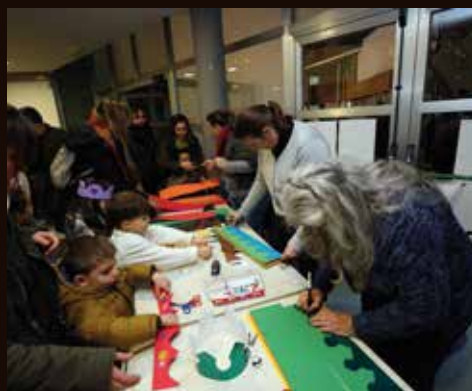
Els tallers de fanalets i corones van servir per preparar l'arribada de Melcior, Gaspar i Baltasar. RAMON BOADELLA