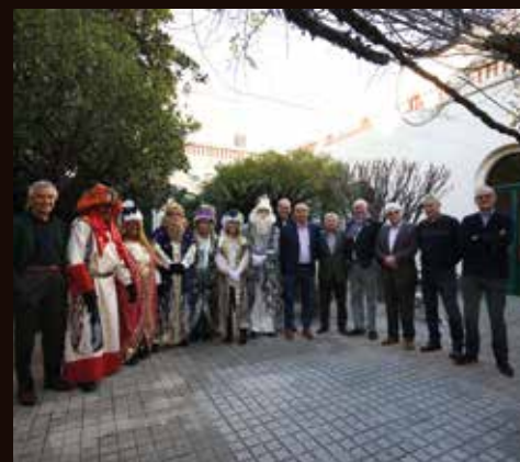
Abans de deixar la vila, els Reis Mags van passar per la Casa Benèfica. RAMON BOADELLA