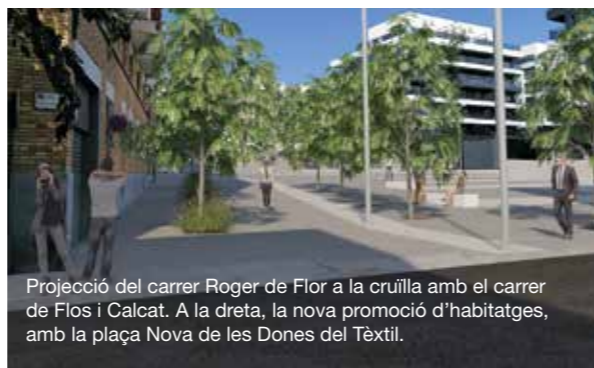
Projecció del carrer Roger de Flor a la cruïlla amb el carrer de Flos i Calcat. A la dreta, la nova promoció d'habitatges, amb la plaça Nova de les Dones del Tèxtil.