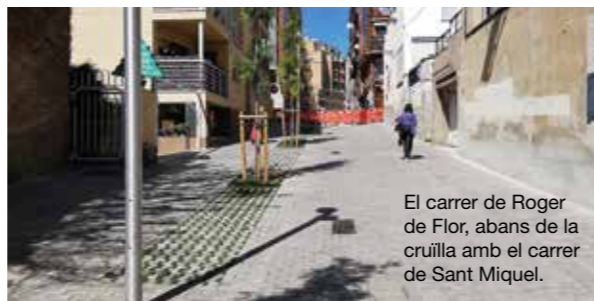
El carrer de Roger de Flor, abans de la cruïlla amb el carrer de Sant Miquel.