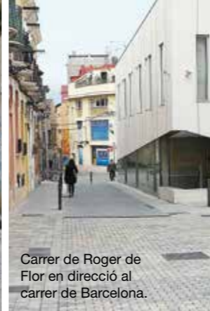
Carrer de Roger de Flor en direcció al carrer de Barcelona.