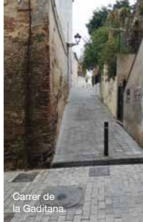
Carrer de la Gaditana.