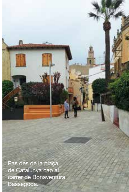
Pas des de la plaça de Catalunya cap al carrer de Bonaventura Bassagoda.

Els carrers de Sant Miquel, Navarra, Flos i Calcat, Francesc Macià i Itàlia, entre els carrers de Romà Fabra i del Pintor Domènech Farré. En el cas del carrer de Francesc Macià, només per a l'accés del veïnat i els guals.