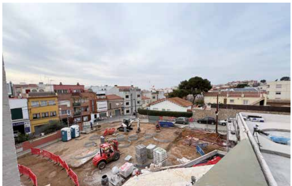
▲ La reurbanització d'aquest espai inclou la creació de la nova plaça de l'U d'Octubre i dos locals, que estaran enllestits d'aquí a uns mesos. MIREIA CUXART

Dels nous habitatges, cinc són de tres habitacions; trenta són de dues habitacions i cinc