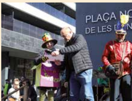
▲ "Caixa sorpresa" Millor disfressa individual