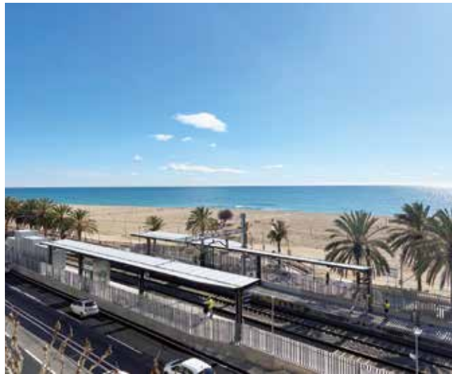
▲ En el moment de tancar aquesta edició, Renfe no n'havia concretat la data de l'obertura.

Les obres van començar el març del 2022, moment en què també es va anul·lar l'estació. Inicialment, Renfe