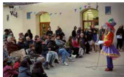
▲ La Reina Carnestoltes va proclamar la República del Carnaval. ANNA OLIVA