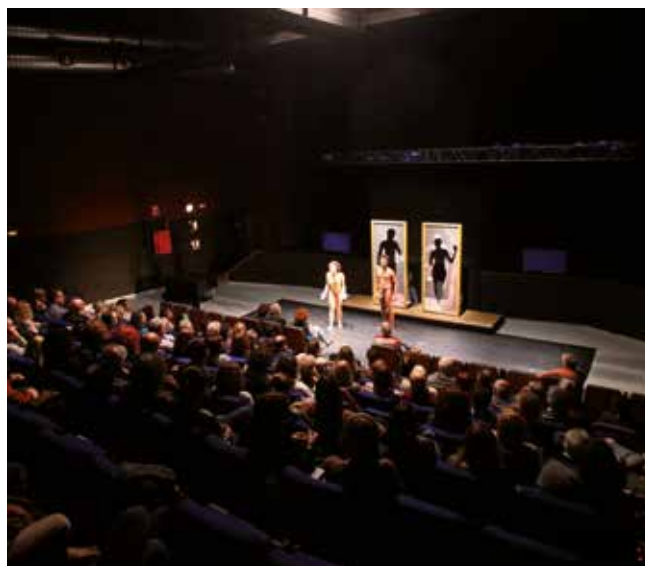
▲ ' Adam i Eva ', dissenyat i dirigit per Iago Pericot, es va representar a l'Espai Escènic l'any 2017. RAMON BOADELLA

De fet puc dir que aquest any hi torno! Tots els que hi hem participat coincidim que és un festival que ens agrada molt. Fer un escenari en un lloc com la platja sempre és més complicat, hem de perforar bastant perquè s'agafi en un lloc més sòlid, i sembla que busquem petroli! ■