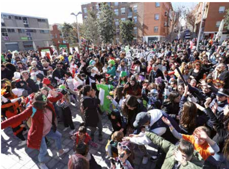
▲ El Carnaval va omplir de gresca i diversió els carrers. RAMON BOADELLA