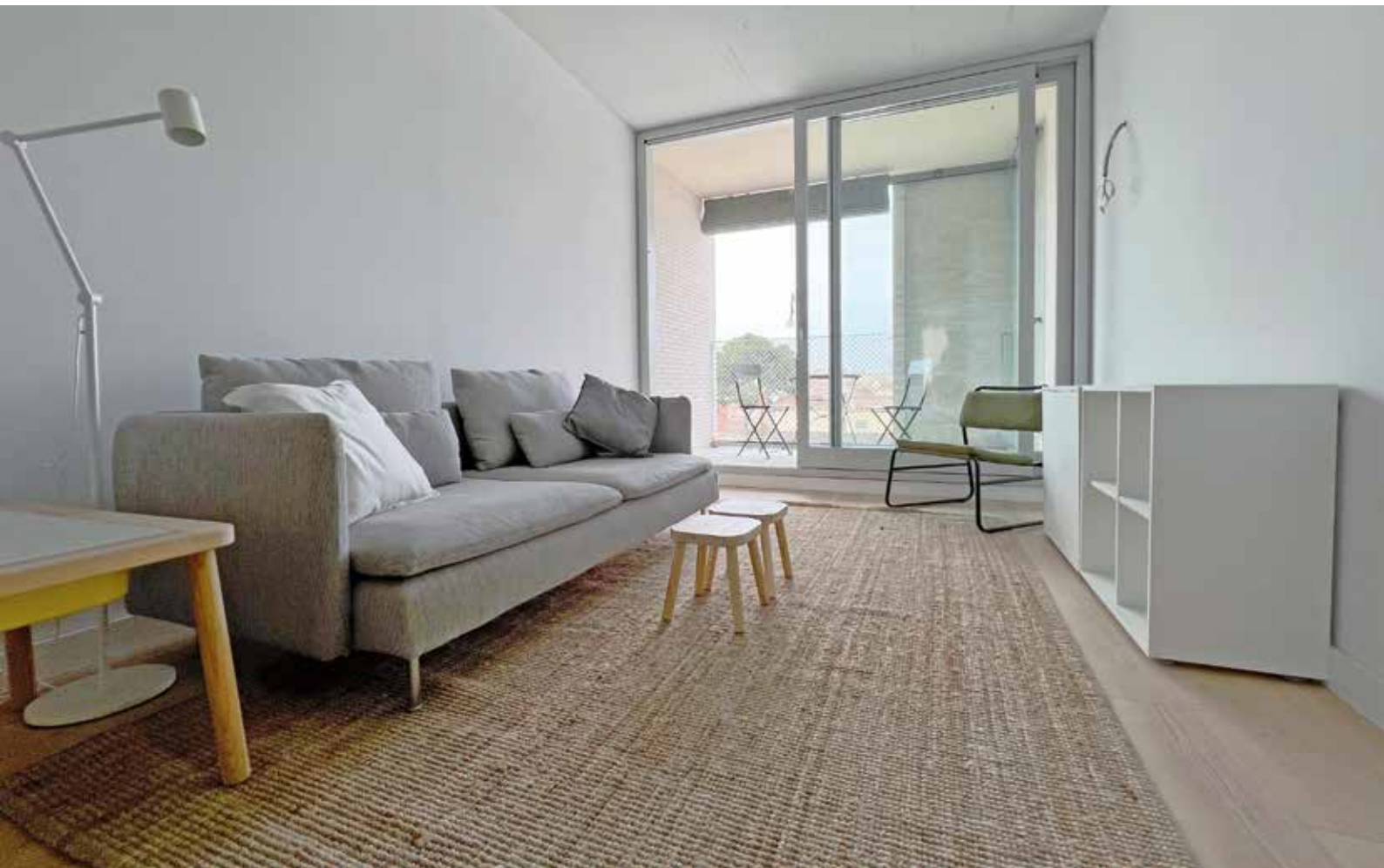
▲ Interior del pis de mostra de la promoció de la plaça de l'U d'Octubre. MIREIA CUXART

són d'una habitació. Aquesta diversitat tipològica respon a la voluntat d'afavorir la pluralitat poblacional. Tots van ser adjudicats al sorteig que es va fer entre les 357 persones sol·licitants el 12 de juliol passat.