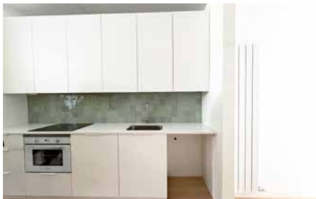
▲ La cuina d'un dels nous habitatges. MIREIA CUXART

planta baixa que també es destinarà a equipament municipal. De fet, l'Ajuntament preveu traslladar-hi l'Oficina d'Atenció Ciutadana (OAC). També s'hi va fer una visita d'obres i es treballa amb la previsió que el lliurament d'aquesta promoció pugui fer-se l'estiu de 2025. Ambdues promocions incorporen 107 habitatges al parc públic del municipi. ■