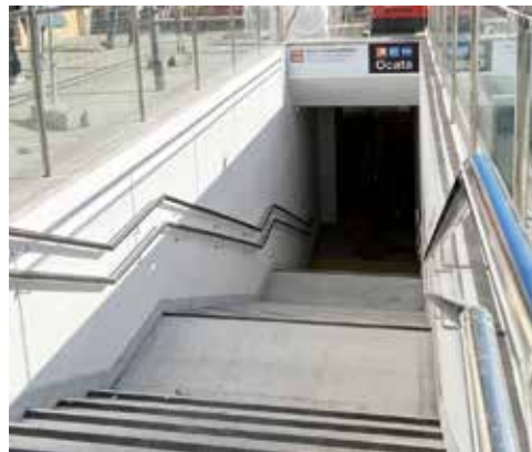
▲ Les noves escales que condueixen a l'estació. MIREIA CUXART