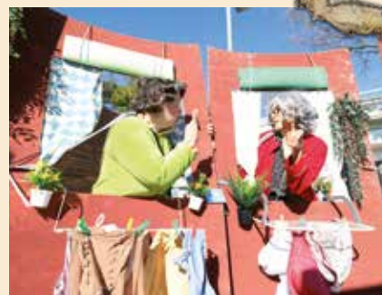
▲ "La balconera" Millor disfressa i originalitat + millor posada en escena (comparses)