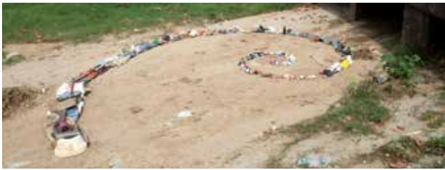
▲ "Riera tour" és el resultat d'una investigació artística col·lectiva sobre la riera d'Alella.

L'espai natural urbà ha estat font d'inspiració per a una exposició col·lectiva