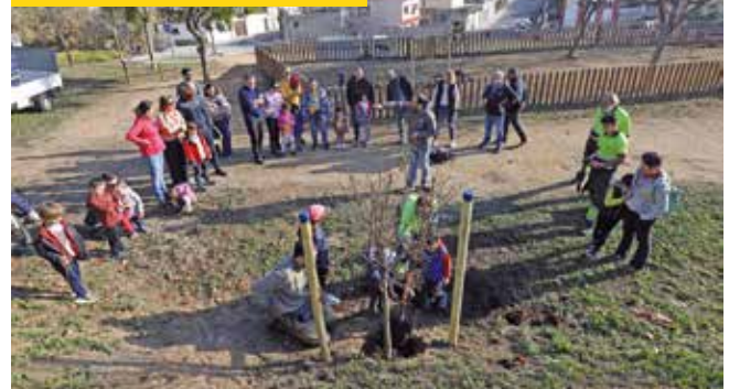
▲ Al parc s'hi van plantar 14 arbres més. RAMON BOADELLA