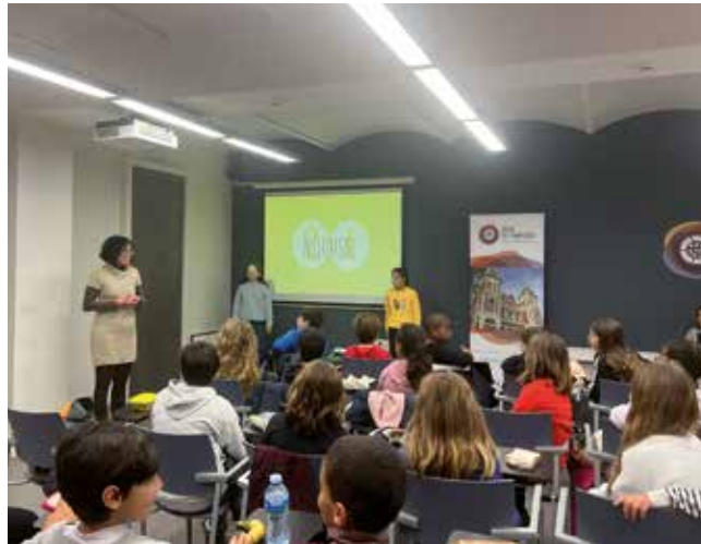
▲ La cooperativa es dedicarà a construir bols i làmpades amb paper.

Respecte al nom de la cooperativa, van concretar que significa 'vint-i-quatre' en japonès. És el nombre d'alumnes que forma la classe que l'ha creat. L'han bastit escollint de manera democràtica els càrrecs de l'empresa, designant l'equip directiu i els membres dels departaments