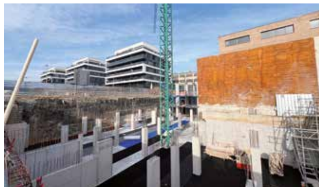
▲ Les obres de la promoció de la plaça Nova de les Dones del Tèxtil avancen a bon ritme. MIREIA CUXART