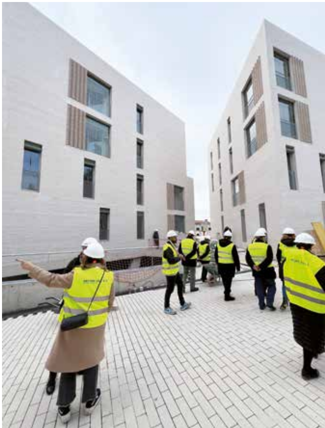
▲ Els dos blocs d'habitatges han estat dissenyats amb criteris d'eficiència energètica. MIREIA CUXART

Les obres de la nova plaça del Masnou que dona accés als habitatges encaren la recta final