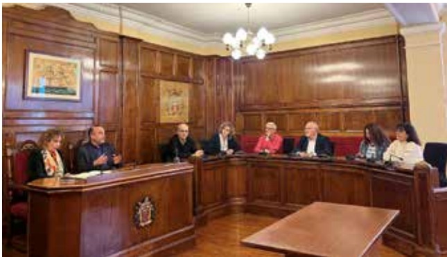
▲ Visita institucional de la consellera Ester Capella. MIREIA CUXART

Una consellera de la Generalitat i un alt càrrec de la Diputació s'interessen pels reptes del municipi en matèries de mobilitat, habitatge i comerç, entre d'altres