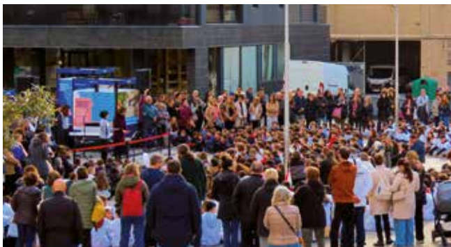
▲ La plaça Nova de les Dones del Tèxtil va acollir l'acte. ANNA OLIVA

Tal com es va fer l'any passat i després de la bona acollida, per poder donar cabuda a tot l'alumnat, la sessió de cloenda, que serà el 8 de maig, tindrà lloc a l'Espai Escènic Iago Pericot. ■