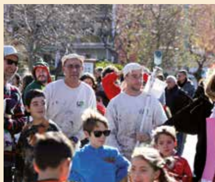
▲ "Els pintors" Millor grup