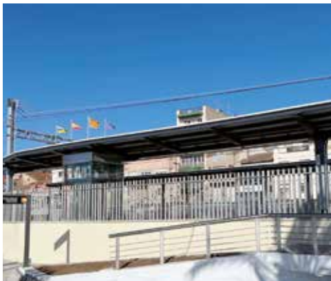
▲ S'hi han instal·lat grans marquesines. MIREIA CUXART

A més de la nova estació, soterrada i totalment accessible per a les persones amb mobilitat reduïda, s'hi ha creat un nou pas soterrat per arribar al passeig Marítim i la platja. També s'hi han incorporat ascensors, per garantir l'accessibilitat de les persones usuàries. L'estació és completa amb la instal·lació de nous controls d'accés a les andanes i de noves marquesines. A més, s'hi ha adequat i s'hi ha millorat l'enllumenat, i se n'han renovat les instal·lacions de sanejament. ■