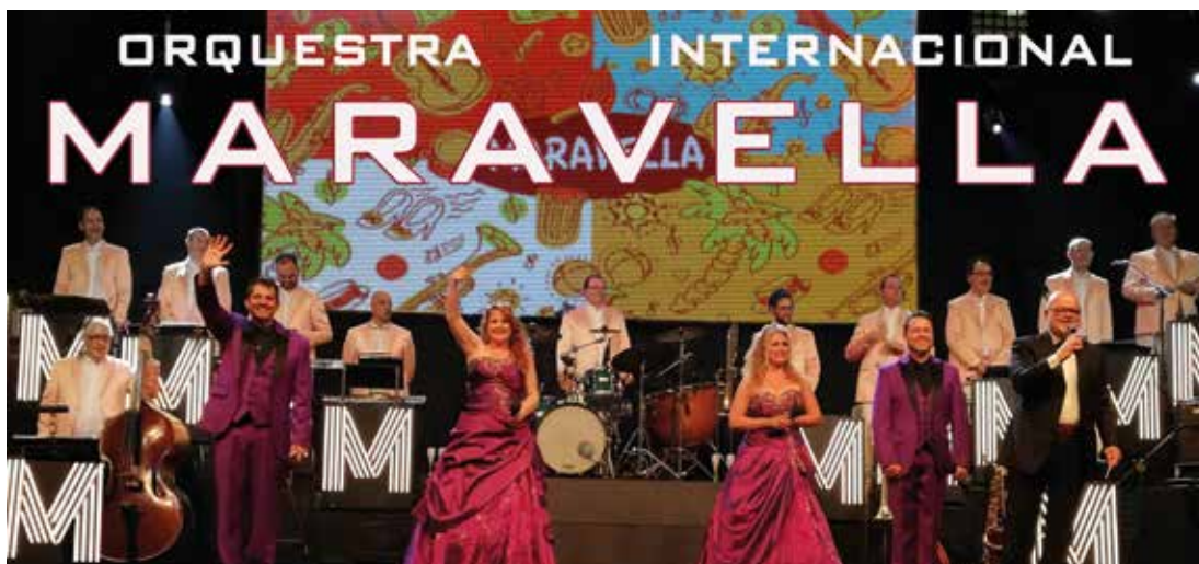
▲ L'Orquestra Maravella és un clàssic a la cita anual de la Festa Major del Masnou.

La missa solemne concelebrada és l'acte més tradicional de la celebració en honor al patró del Masnou, Sant Pere, i coincidirà amb l'últim