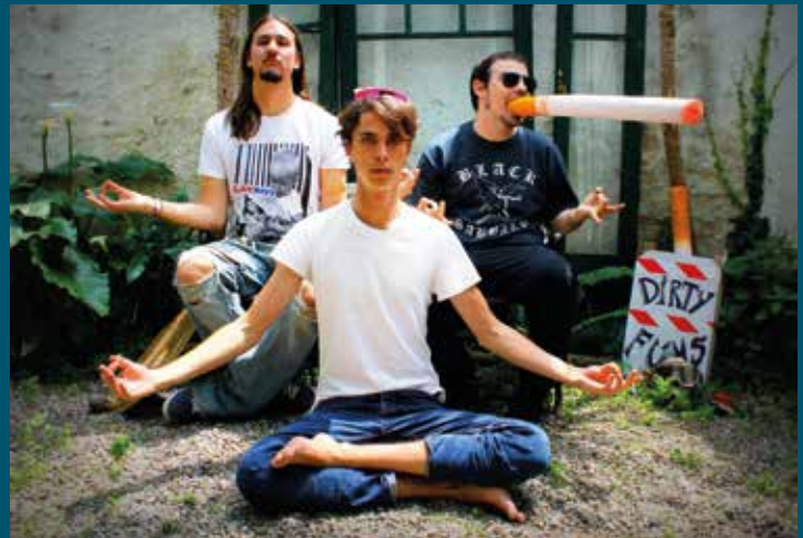
▲ Tres dels quatre components de The Dirty Fools. ARIADNA CARBONELL

Ha estat una relació difícil. El Cesc i l'Edu treballen exclusivament en el món de la música i han estat els més afectats. El confinament domiciliari ens va agafar quan estàvem enregistrant el nostre nou àlbum i vam decidir revisar material antic. Un àlbum perdut, un flashback . L'estiu del 2016 vam registrar un àlbum que vam abandonar, derrotats per una batalla informàtica. Per fer front al temps aparentment infinit, vam restaurar-ne les pistes originals, vam regravar les perdudes i vam ultimar la mescla. Així, a l'abril i en directe, trobant la complicitat de les amigues en les videotrucades de la tarda, vam publicar Criminal Records , un mitja durada