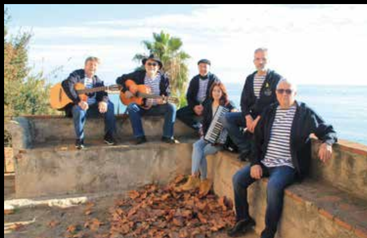
▲ També podreu escoltar les havaneres de la formació masnovina Borinquen.