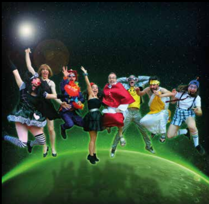
▲ A la nit, al camp de futbol municipal d'Ocatà hi actuarà La Loca Histeria.

municipal d'Ocatà. Esbojarrats i entranyables a parts iguals, oferiran un espectacle sense interrupció de música servida des de la teatralització dels personatges que conformen el grup, amb molt de dinamisme, humor i un toc de surrealisme, un espectacle ja adaptat a aquesta nova realitat. El seu repertori infal·lible dels clàssics universals de tots els estils i totes les èpoques musicals enganxa un públic de totes les edats, que es farà còmplice del xou des del primer tema. ■