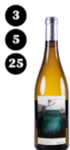
La Nurieta Raventós d'Alella