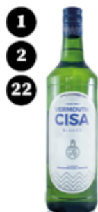
Vermut blanc Cisa