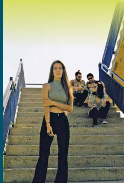
▲ Imatge promocional de Reland. FANNY ORTIZ