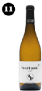
Testuan 3 Testuan