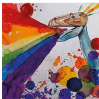
▲ Novina serà protagonista del fons del fotoreclam per la diversitat.

acolliran la representació teatral Yerma , a càrrec de Xabyer Cámara.