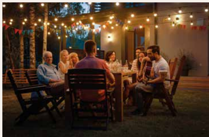
▲ Es recomana celebrar la revetlla en grups reduïts de màxim deu persones del cercle més proper.

Al Masnou es preveu un reforç extraordinari de la seguretat al litoral i s'actuarà quan s'apreciïn zones en les quals l'aglomeració sigui excessiva