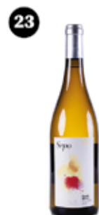
Sepo Raventós d'Alella