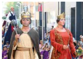
▲ Els gegants dansaran al parc del Llac. RAMON BOADELLA

L'esport encetarà el dia 27: l'associació esportiva LGTBI+ Panteres Grogues organitza un torneig de vòlei platja. També serà el dia del concurs de paelles, organitzat per l'Associació de Veïns i Veïnes del Masnou Alt, i el concurs de mascotes Ple de Peluts, ideat per les entitats Fem Fira i G & G Rescat. A la tarda, la colla bastonera del Masnou Ple de Cops farà una exhibició de balls de cultura popular tradicional a través del ball de bastons i l'entitat Country Ocata convida a tothom qui ho vulgui a endinsar-se en aquest ball i provar-lo. Les sardanes també seran presents a la Festa Major amb la Cobla Jovenívola de Sabadell, una activitat que compta amb la col·laboració de l'Agrupació Sardanista del Masnou. Us agrada el swing? Doncs l'entitat Ple de