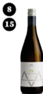
Pansa Blanca Alta Alella