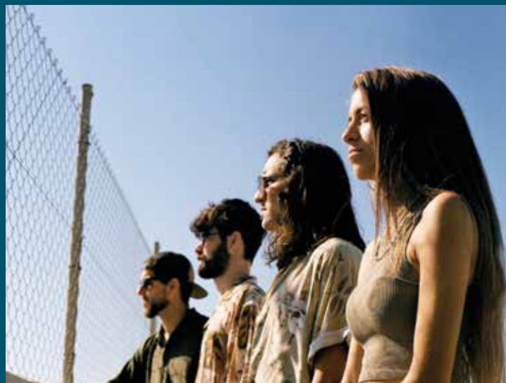
▲ Els integrants del grup sumen diversos premis al concurs de música jove Maresmusic. FANNY ORTIZ

Sempre fem broma i diem que l'any que ve tocarem al Primavera Sound, però, tocant de peus a terra, el projecte més tangible que tenim és un EP [ extended play , àlbum de reproducció estesa] i un videoclip que teníem pensat publicar al juny, però que hem aparcat una mica per dedicar-nos plenament a assajar per al bolo. Una cosa de la qual tenim també moltes ganes és de fer molts concerts. ■