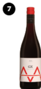
Gamatxa Alta Alella