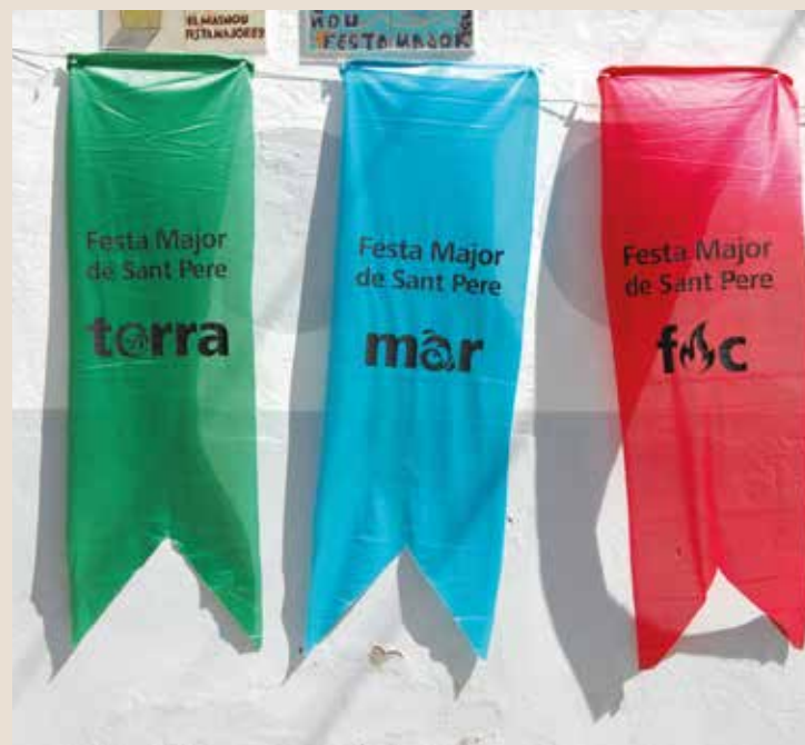
▲ Les banderoles representen la terra (verdes), el mar (blaves) i el foc (vermelles). MIREIA CUXART

Traieu de l'armari les ja característiques banderoles i engalaneu els balcons, que comença la Festa Major!