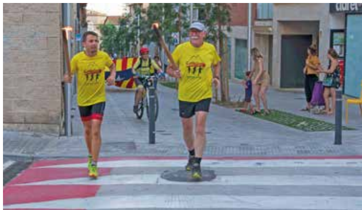
▲ La Flama del Canigó arribarà fins a la plaça Nova de les Dones del Tèxtil. RAMON BOADELLA

Seguint els consells de Protecció Civil de la Generalitat, es recomana evitar la tradicional comitiva de masnovins i masnovines durant el recorregut de la Flama. Al seu destí final, la plaça Nova de les Dones