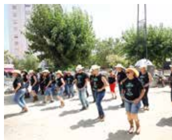
▲ Hi haurà diferents mostres de ball, com la de Country Ocata. RAMON BOADELLA