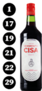
Vermut negre Cisa