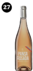
Pansa Rosada Raventós d'Alella