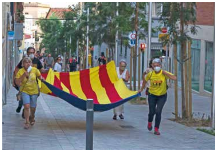
▲ El Procicat recomana evitar la tradicional comitiva durant el recorregut. RAMON BOADELLA