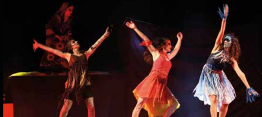
▲ Les nimfes escenificaran la llegenda dels elements identitaris de la festa. RAMON BOADELLA

totes tres nimfes, amb el poder conferit de les seves coronacions, van fer aparèixer un nou element màgic, Novina, que vol ser una representació de les tres nimfes, per tal que puguin estar presents entre els masnovins i masnovines durant la Festa Major. ■