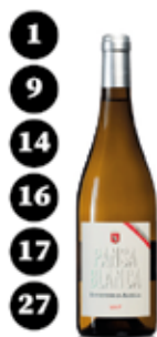
Pansa Blanca Raventós d'Alella