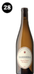
Sarriera Raventós d'Alella