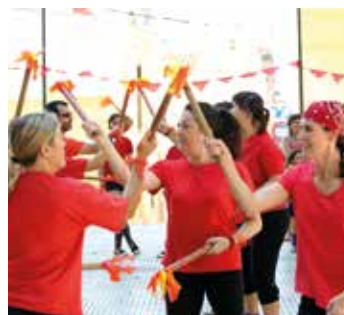
▲ La colla bastonera Ple de Cops farà una exhibició. RAMON BOADELLA

Swing muntarà una classe oberta de solojazz (swing individual).