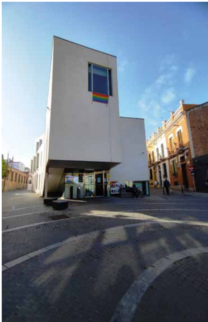
▲ La plaça de la Igualtat s'ubicarà al davant de l'edifici de Roger de Flor, 23. AJUNTAMENT

La programació combina activitats telemàtiques amb d'altres de presencials que requereixen inscripció prèvia. En el moment de tancar aquesta edició en quedaven pendents de realitzar algunes durant els dies de la Festa Major i, també, els dies previs i posteriors. En aquest sentit, el 22 de juny, al cinema La Calàndria s'hi projectarà i s'hi presentarà el documental Enfemme , i el dissabte 26 a la tarda, els jardins de Can Malet