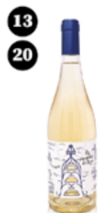
Les Campanes de Lima L'Artesà del Temps