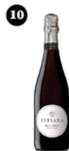
Titiana Pinot Noir Parxet

L'Escuracassoles és un recorregut enogastronòmic per trenta establiments del municipi que us permetrà gaudir d'una oferta gastronòmica singular, maridada amb vins de la DO Alella o vermut Cisa i dissenyada exclusivament per a l'ocasió.