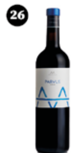
Parvus Syrah Alta Alella