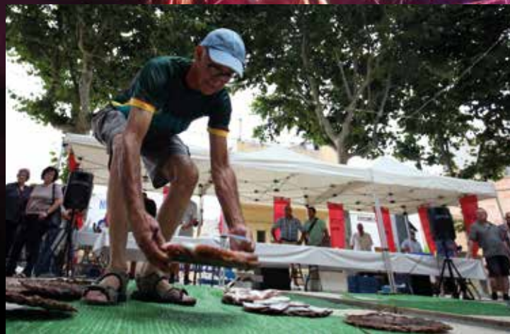
▲ La plaça d'Ocatà acollirà la subhasta cantada de peix.

La nit del 28 hi ha programades les havaneres de la formació masnovina Borinquen al parc del Llac abans que el cel del Masnou es torni a il·luminar amb l'espectacle pirotècnic per excel·lència, el castell de focs, a càrrec de la Pirotècnia Mediterráneo. Enguany, la totalitat de l'espectacle pirotècnic s'eleva a gran alçària i la tirada es farà des d'un punt que permetrà que es visualitzi des de