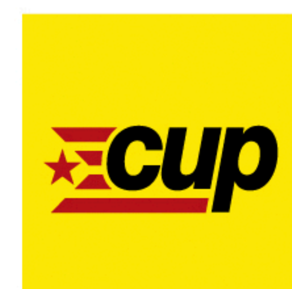
Grup Municipal de la CUP-PA