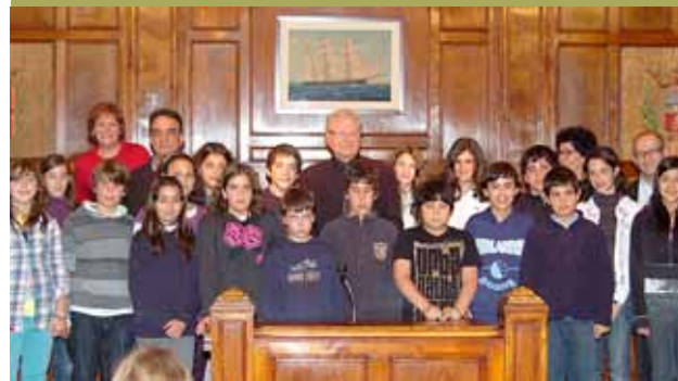
Foto de grup durant la cloenda.