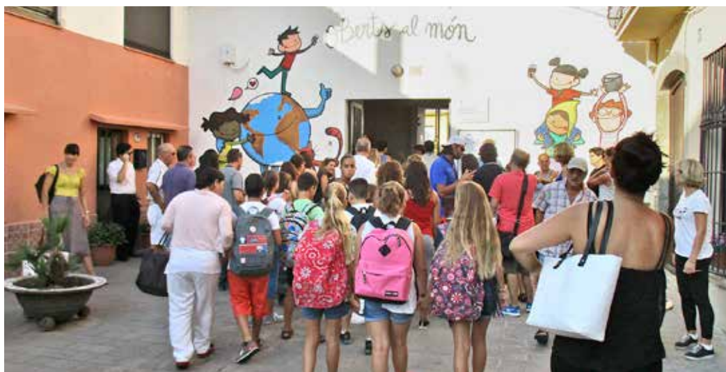
L'alumnat de l'escola Sagrada Família entrant al centre el primer dia del curs 2016-2017.