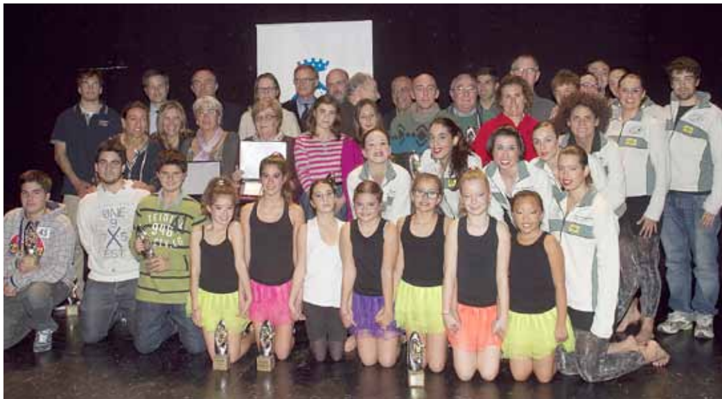
Foto dels participants, guanyadors i organitzadors dels premis.

L'Espai Escènic Ca n'Humet s'omple en reconeixement a la tasca de les persones i entitats que dinamitzen la vila