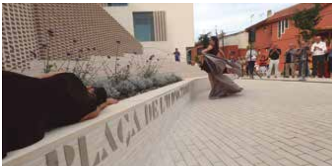
▲ Dues ballarines van fer una original descoberta de les lletres que donen nom a la plaça mentre dansaven.