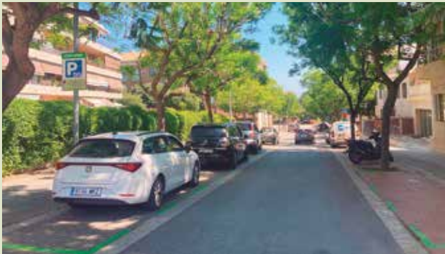
▲ Els residents del final del barri d'Ocata també han passat a tenir prioritat per aparcar a la zona verda. DOMÈNEC CANO

Per tal de fer més entenedors els canvis, l'Ajuntament ha preparat un document de preguntes freqüents que pretén resoldre els dubtes més habituals sobre la nova regulació. Aquí se'n reproduïx una part i el podeu consultar sencer escanejant el codi QR