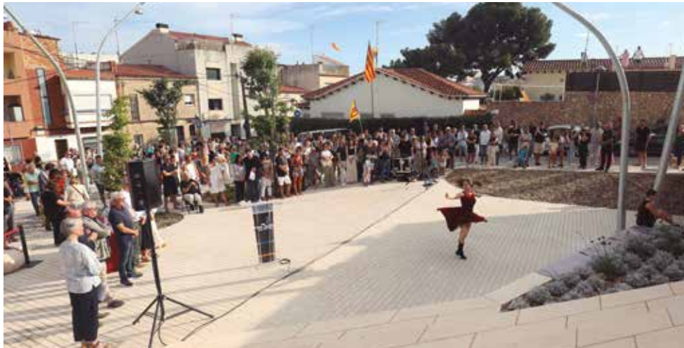
▲ L'acte va servir perquè la ciutadania conegués aquest nou espai públic, que commemora els fets de l'1 d'octubre de 2017 al Masnou.