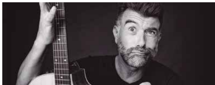
▲ Aquesta edició comptarà amb el reconegut humorista i imitador Pep Plaza.