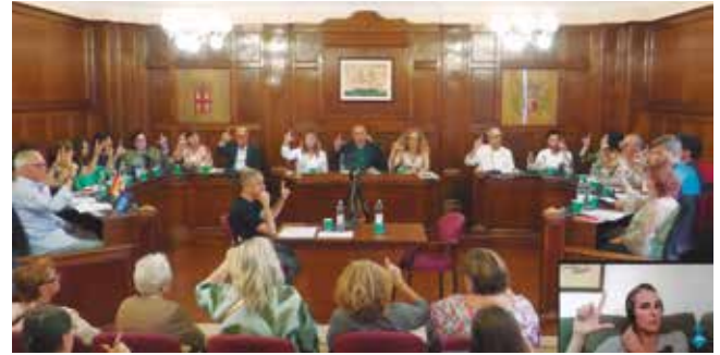
▲ Tots els edils del Ple van fer un gest per l'ELA per mostrar el seu suport a les reivindicacions de les persones afectades d'esclerosi lateral amiotròfica i les seves famílies.