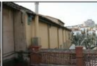
Façana pati Casals