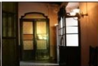
Sorció d'emergència vestíbul P1