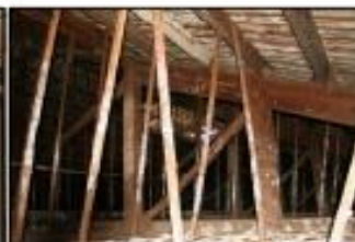
Encara obra S4