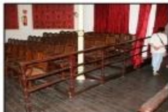
Sala, accés pista