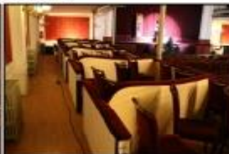
Sala, balçó PB