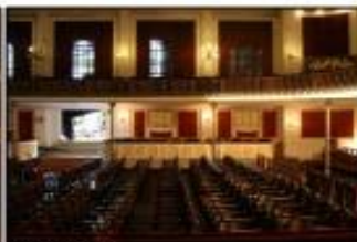
Sala, vista lateral