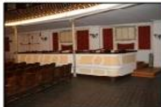
Sala, balçó PB