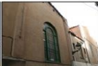
Façana casa Roger de Flor (dreta vosta) P1