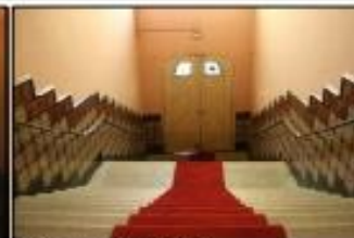
Sorció d'emergència vestíbul P1