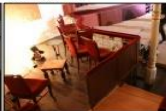
Sala, balçó proseni