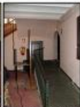
Rampa accés vestíbul PB