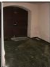
Accés correr vestíbul PB