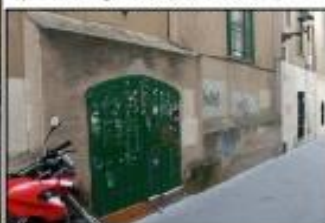
Façana casa Roger de Flor (Acadè vosta) P8