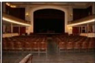
Sala, vista des del fons de la pista