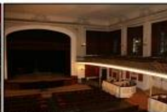
Sala, vista des de l'escenari