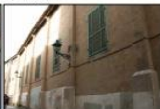
Façana casa Roger de Flor (Façana s4)