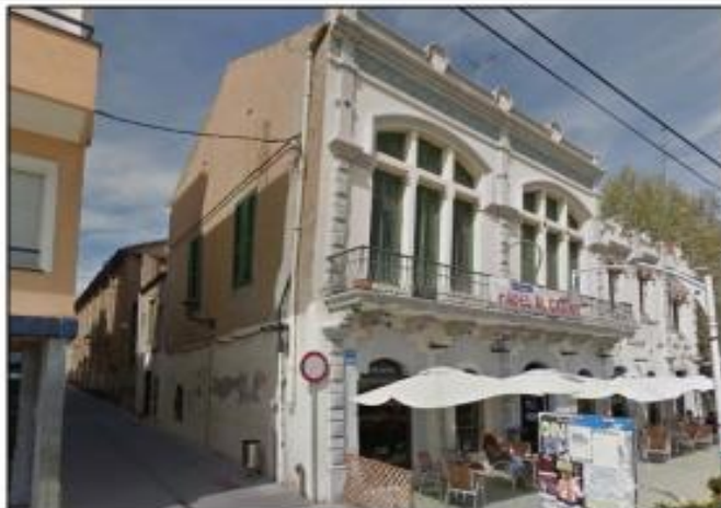
Façana cantonada casa de Barceles, casa Roger de Flor