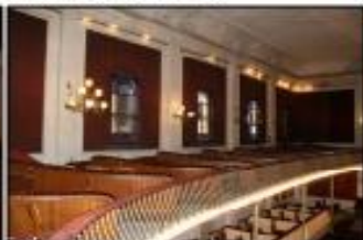
Sala, balçó P1