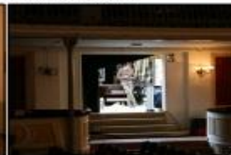
Sorció d'emergència sala