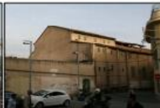
Façana casa Roger de Flor (Torre esportiva)