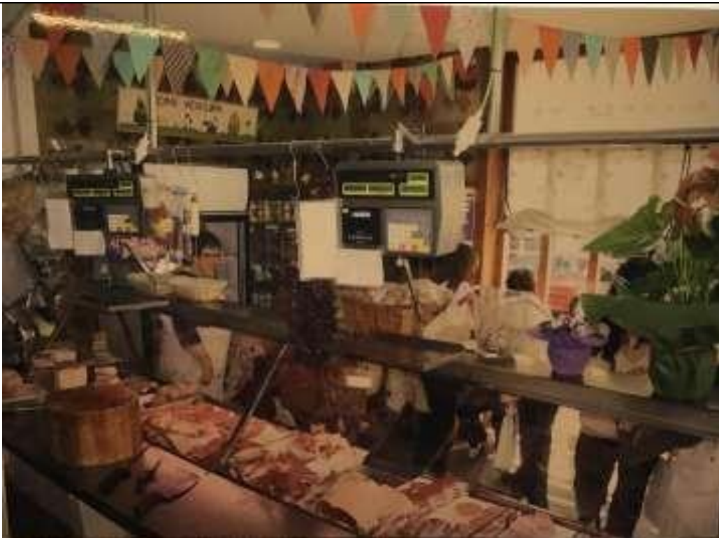
Interior de la botiga, que va ser engalanada amb motiu de la festa del 50è aniversari del negoci. 2014.