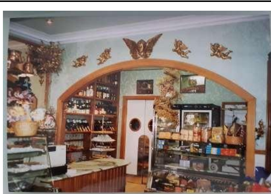
Interior de la pastisseria per Nadal. Al fons s'hi observa la porta de l'obrador. 1995.