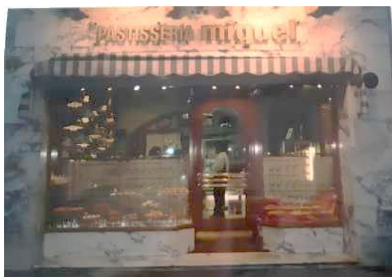
Façana. Anys noranta.