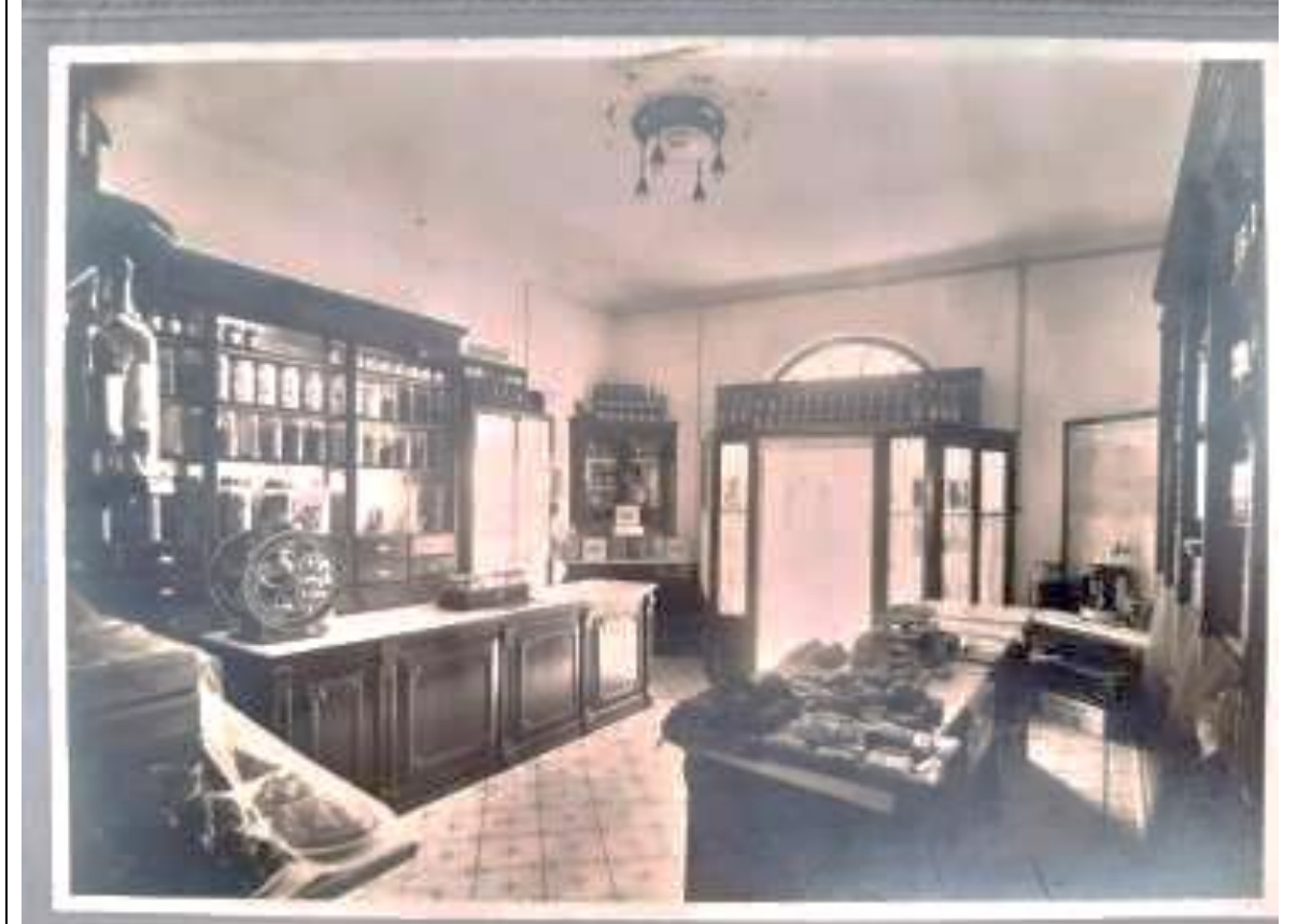
Interior del la pastisseria durant els seus primers anys d'existència. Anys vint.