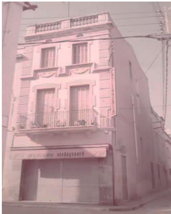
Edifici de la pastisseria. 1970.