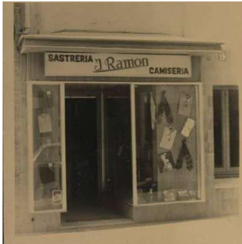
Façana de la sastreria i camiseria. Anys seixanta.