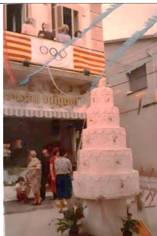
Façana de la pastisseria guarnida amb motiu de les Olimpíades. 1992.