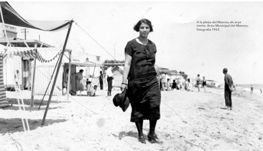
A la platja del Masnou als anys trenta.