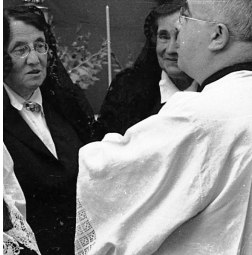
Benedicció de l'església del Pilar, l'11 d'octubre de 1953. (Fotografia 10214)