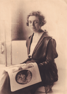
Retrat de l'any 1921. Procedent de la família Hansen-Fors.