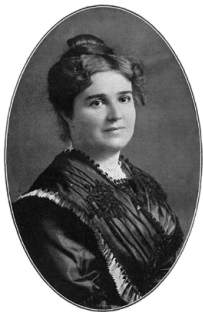
Retrat procedent de La Il·lustració Catalana , 28/4/1912, núm. 464, pàgina 7.

Per haver desenvolupat una tasca important a Catalunya, tant en la divulgació de nous corrents i experiències, com per la seva capacitat d'organització de centres escolars, es va posar el seu nom a l'Escola de Mestres Rosa Sensat, fundada el 1965 pel col·lectiu de mestres liderat per Marta Mata i Garriga.