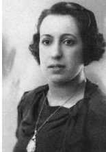
Retrat procedent de la família Portell-Ferrer, publicat a Gent del Masnou , número 330, d'abril de 2015.