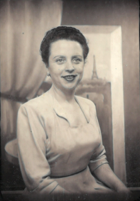
Arxiu Municipal del Masnou, fotografia 32481. Donació de Joan Muray.

La seva trajectòria docent va ser molt curta, del 1934 al 1939, ja que va ser depurada i inhabilitada en acabar la Guerra Civil. Sense poder exercir de mestra, va venir al Masnou, on vivien uns oncles seus i on va passar la resta de la seva vida. Va obrir una botiga de calçat que va dur el seu nom al carrer de Josep Llimona. Va escriure un llibre de memòries que es va publicar el 2008 amb el títol El calvari d'una mestra . Se li han fet actes de reconeixement a Torrelavit (on va ser mestra) i a Figueres.