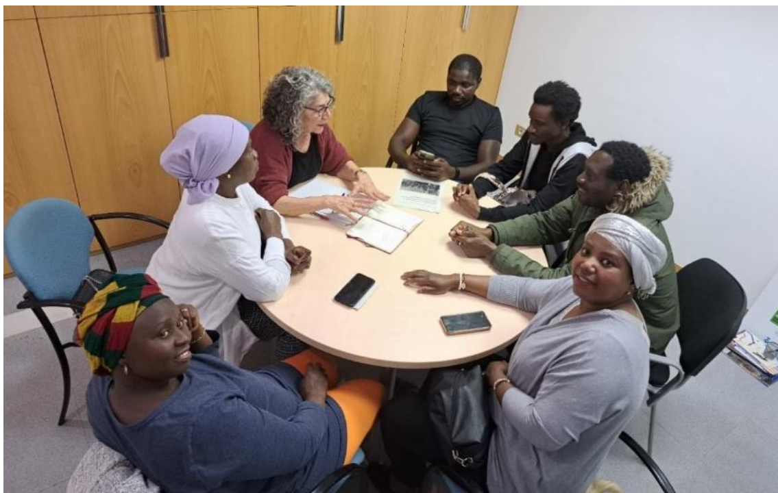
Grup impulsor Senegambià

Destaquem, una vegada més, el caràcter obert i versàtil del programa "Parla'm de tu", ja que, en funció dels participants, evoluciona i es materialitza de maneres diferents.