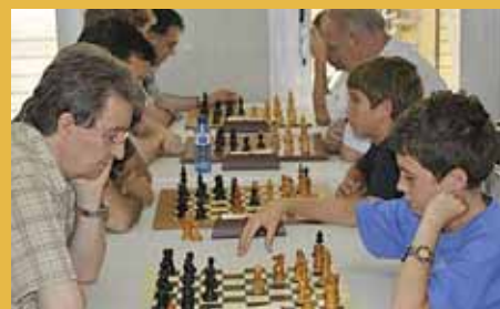
CLUB D'ESCACS EL MASNOU