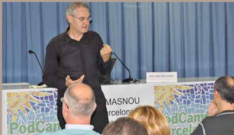
Un dels participants a la PodCamp del 2008.

El 19 de setembre, el Masnou torna a acollir una nova edició de la PodCamp Barcelona. Aquesta trobada s'adreça a persones entusiastes i professionals de les noves tecnologies, com ara bloggers , podcasters , Youtubers , membres de les xarxes socials i qualsevol que tingui curiositat per aquest tema. Com ja va passar l'any passat, la trobada se celebrarà a l'Edifici Centre, i enguany hi participaran professionals i persones enteses procedents d'arreu