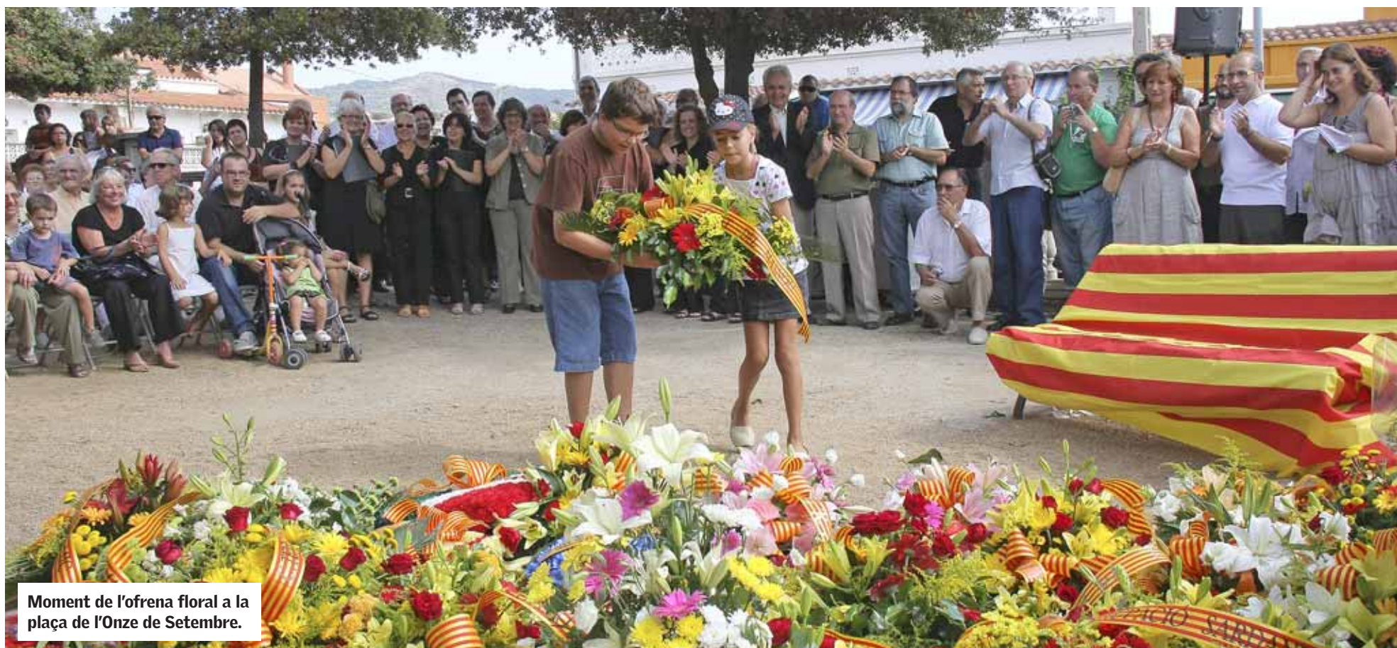
Moment de l'ofrena floral a la plaça de l'Onze de Setembre.

La celebració de l'Onze de Setembre torna a reunir entitats, partits i ciutadania a l'ofrena floral