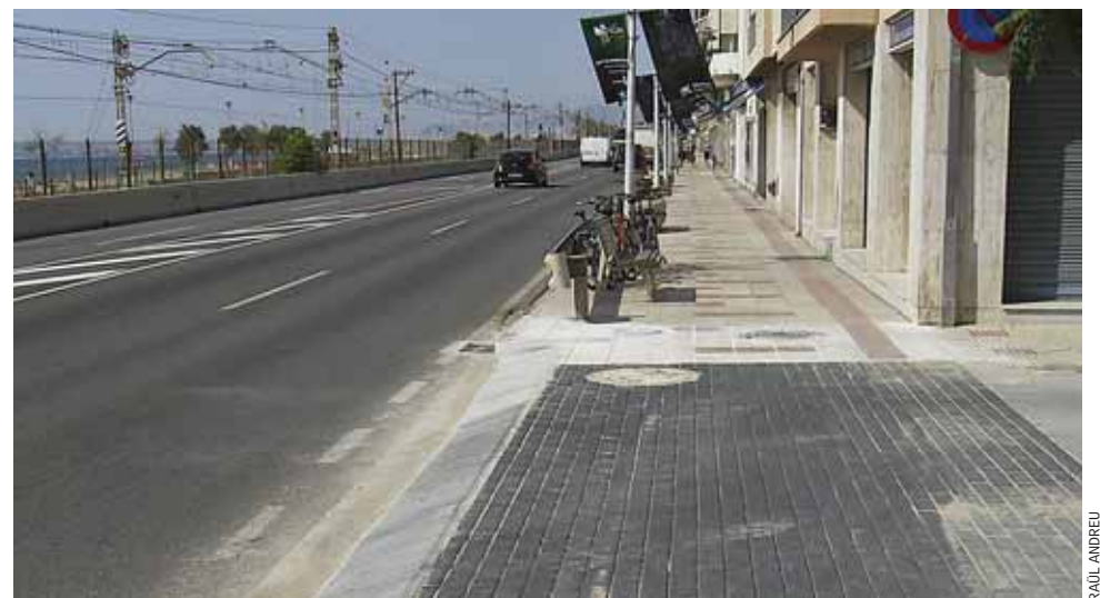
Evolució dels treballs al Camí Ral.

També segueixen en marxa els treballs al carrer de Sant Felip. Allà s'han resolt tots els problemes apareguts al primer tram (entre els carrers de Capitans Comellas i Doctor Agell). A mitjan setembre és previst que se'n compacti el ferm per fer possible l'accés als garatges. D'altra banda, les noves voreres, els escocells i els nous fanals ja hi estan instal·lats. Pel que fa al segon tram (del carrer Doctor Agell fins a