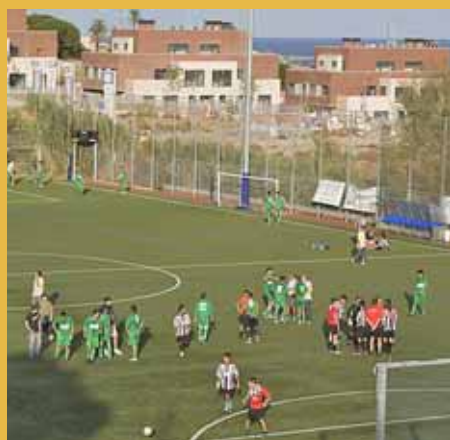
CLUB ATLÈTIC MASNOU

El camp del Club Atlètic Masnou va acollir, el 5 de setembre, una nova edició del Torneig de l'Amistat. Aquest Torneig es fa gràcies a la bona entesa que sempre han tingut els clubs que hi participen: el CF Alella, el CE Cabriels i el Club Atlètic Masnou. ■