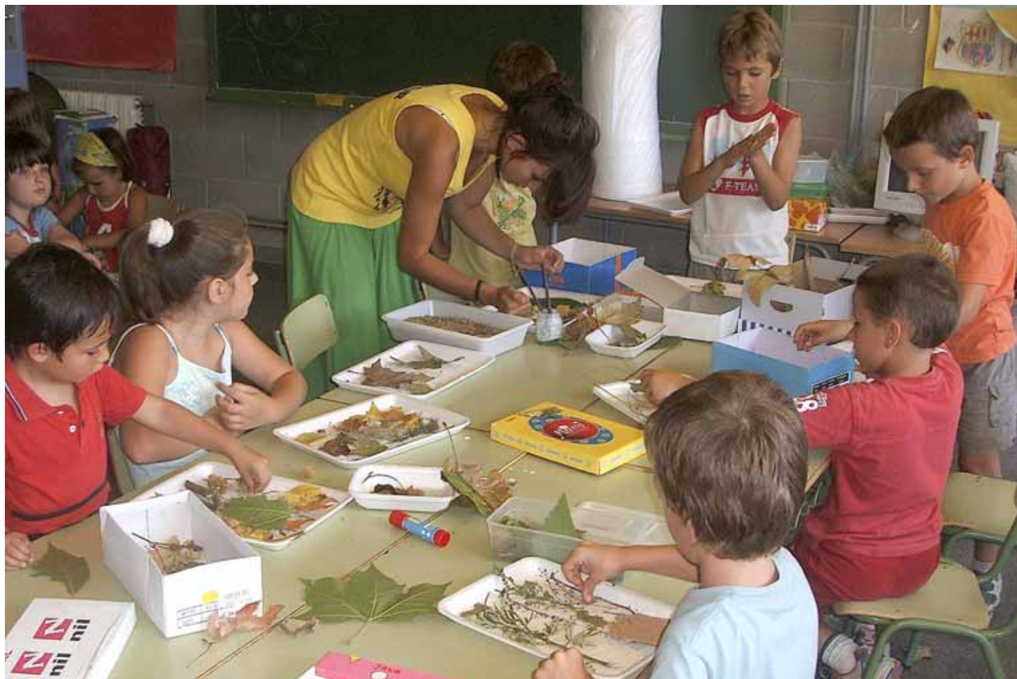
Nens i nenes durant un taller de natura que fa l'entitat.

L'any 2000 va néixer l'escola de natura Ursus, tot i que des de feia molt més temps ja actuava com a grup fent educació ambiental, amb menys mitjans, en el camp de la investigació i la conservació de la natura i la fauna. Actualment, té un grup de treball potent format per una vintena de persones agrupades en tres equips: un equip tècnic, un de monitors i monitores, i un de persones voluntàries.