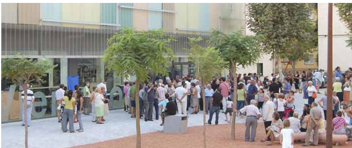
La inauguració dels Vienesos va aplegar un gran nombre de públic.