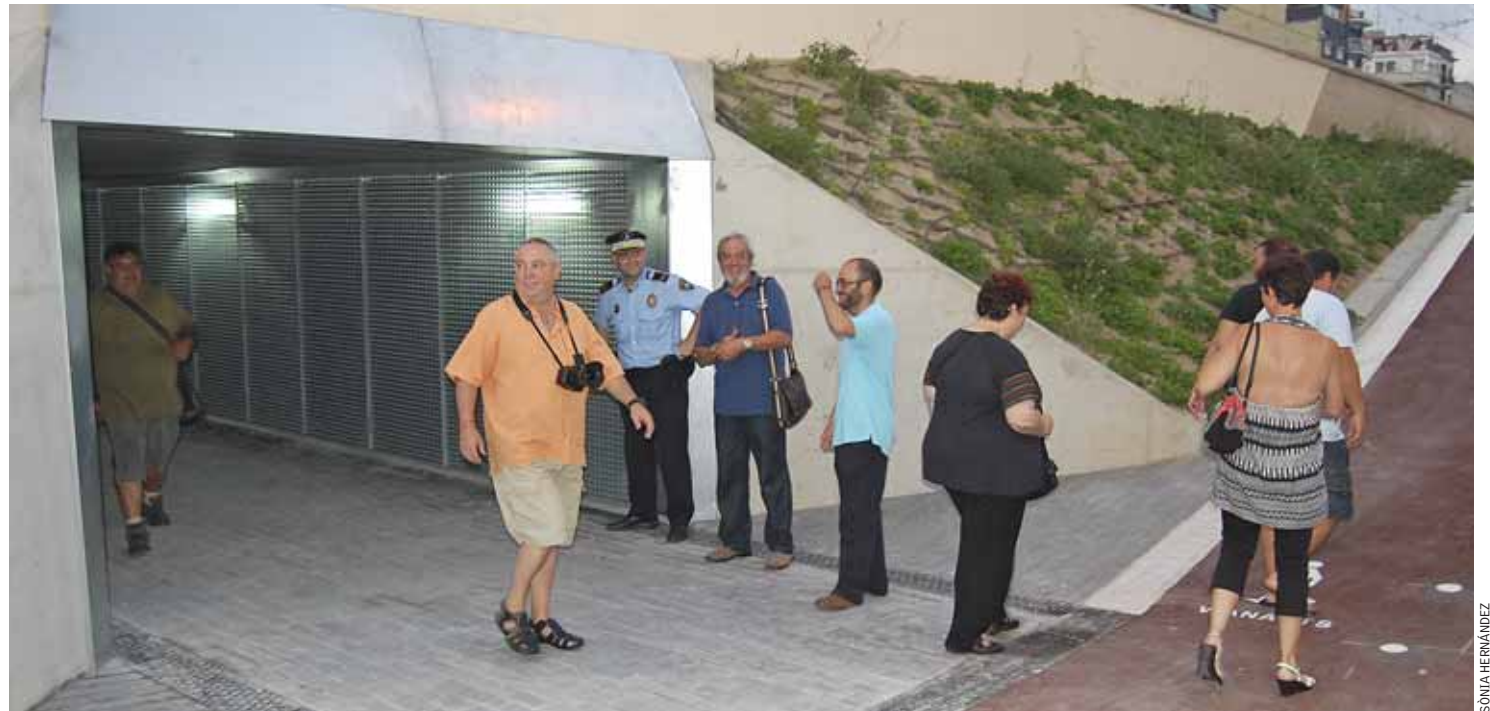
L'accés per a vianants del pas soterrat es va obrir el divendres 21 d'agost.

Amb aquesta obra, que té un pressupost aproximat de 900.000 euros, "s'hauran aconseguit objectius importants, com la primera connexió directa del nucli urbà amb el port i el fet de facilitar aparcament en una zona del Masnou amb una gran mancança en aquest sentit, per a la qual cosa també es construeixen 45 places d'aparcament sota la plaça", segons ha afirmat en diverses ocasions Enric Folch . ■