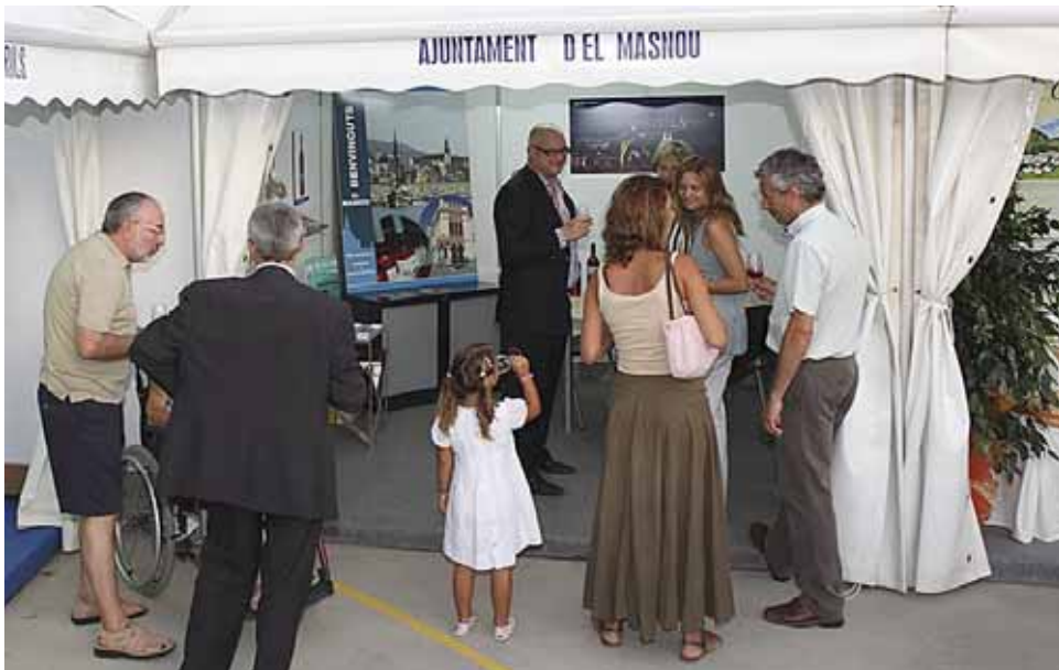
L'Ajuntament del Masnou va comptar amb una parada a la fira.

La 22a edició de la Mostra Gastronòmica, Comercial i d'Artesans de Cabrils es va celebrar entre el 14 i el 17 d'agost i va comptar amb la presència del Masnou com a municipi convidat. Aquestes jornades van reunir els millors restaurants locals i comarcals, que van preparar plats tradicionals i d'altres d'especials. Com a representants del teixit comercial i artesanal masnoví hi van prendre part els