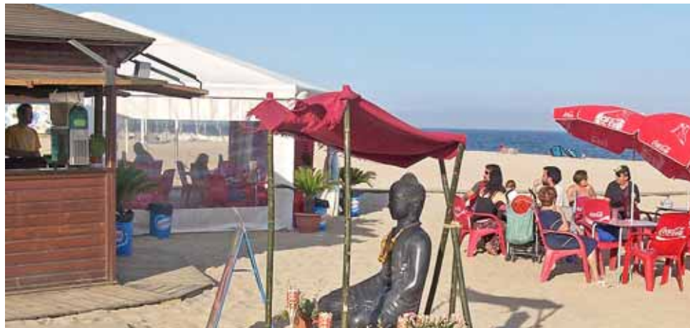
Les guinguetes de la platja han estat centre d'activitats i punt de trobada.

L'Espigó, Superior, Menyo, El Bambú, Calima i El Último Chiringo són els noms de les sis guinguetes que actualment estan instal·lades a les platges del Masnou i d'Ocata. Aquests bars, que conviuen amb la calor del sol i el salnitre de platja, van iniciar la temporada al maig –tot i que el gruix de la clientela l'obtenen durant els mesos de juliol i agost– i tancaran portes a finals d'aquest mes de setembre, tot i que alguns han sol·licitat allargar la llicència tot el mes d'octubre.