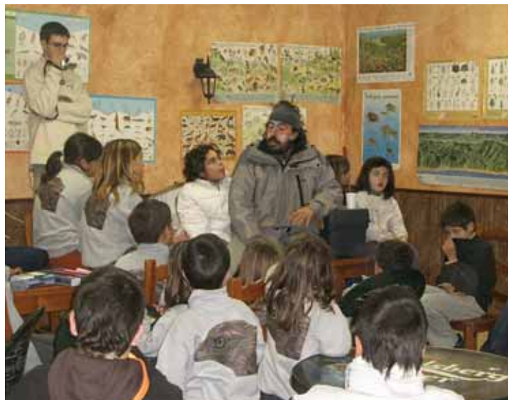
A l'estiu, organitzen el casal d'estiu de natura.

Bé, de fet, no tenir consciència de preservar no significa ser dolent o incívic, és que la gent no és conscient de la fragilitat dels animals salvatges, de com els afecta perdre la qualitat del seu entorn. Al Masnou, la gent col·labora molt, ens avisa i ajuda quan hi ha animals ferits o quan hi ha arbres o plantes malmeses, i si anem ajudant en aquest sentit, estic molt satisfet. Si tanquem els parcs per raons de conservació, la gent ho accepta i m'expliquen coses que veuen dels animals per ajudar. M'agrada aquesta sensació d'implicació.