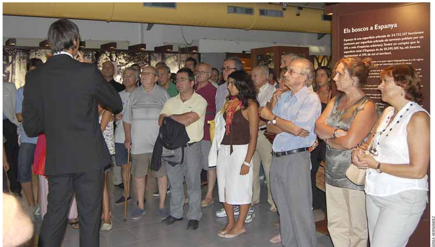
La inauguració de l'exposició va comptar amb una molt bona assistència de públic.