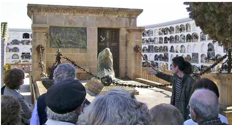
El Cementiri és un veritable museu a l'aire lliure.

El cap de setmana del 25 i 26 de setembre, el Museu Municipal de Nàutica celebra les Jornades Europees del Patrimoni. Un any més, Catalunya s'afegeix a les activitats que es faran durant tot el cap de setmana arreu d'Europa amb una clara finalitat: descobrir aquest llegat excepcional que és el patrimoni cultural i gaudir-ne.