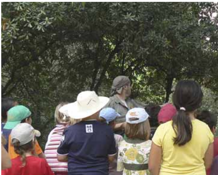
Una de les visites guiades al parc del Llac.