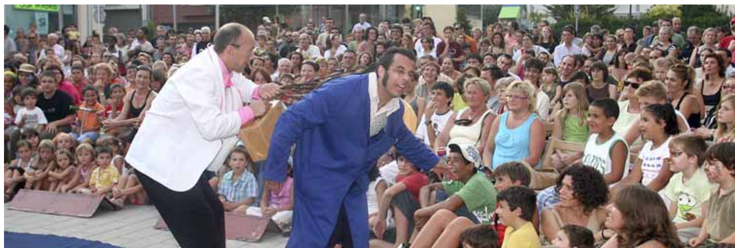
El Mag Lari va actuar al Ple de Riure.