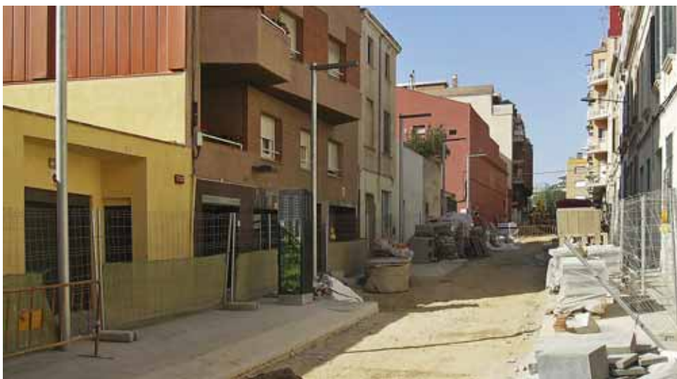
Estat de les obres al carrer de Sant Felip.

Durant el mes d'agost ja han finalitzat les intervencions al carrer del Brasil i als jardins d'Els Vienesos