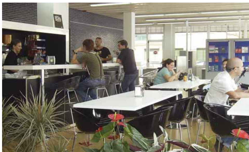
Cafeteria Fora de Sèrie, a Els Vienesos.

per la CTM el dimecres 30 de setembre, al CAP Ocata-Teià, per commemorar el Dia Mundial de la Salut Mental, el 10 d'octubre.