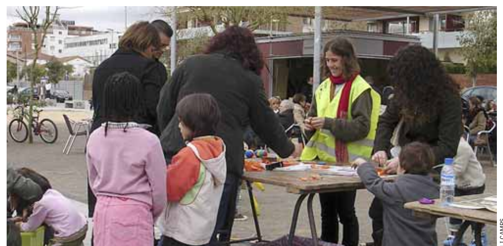
Un dels tallers per a infants realitzats al novembre de l'any passat.

Aquests actes compten amb la col·laboració del CAP del Masnou, Criança Dolça, El Cullerot i les entitats Agrupació Sardanista del Masnou, Associació UNESCO del Masnou, la Jove Orquestra de Cambra del Masnou i Lleureka. ■