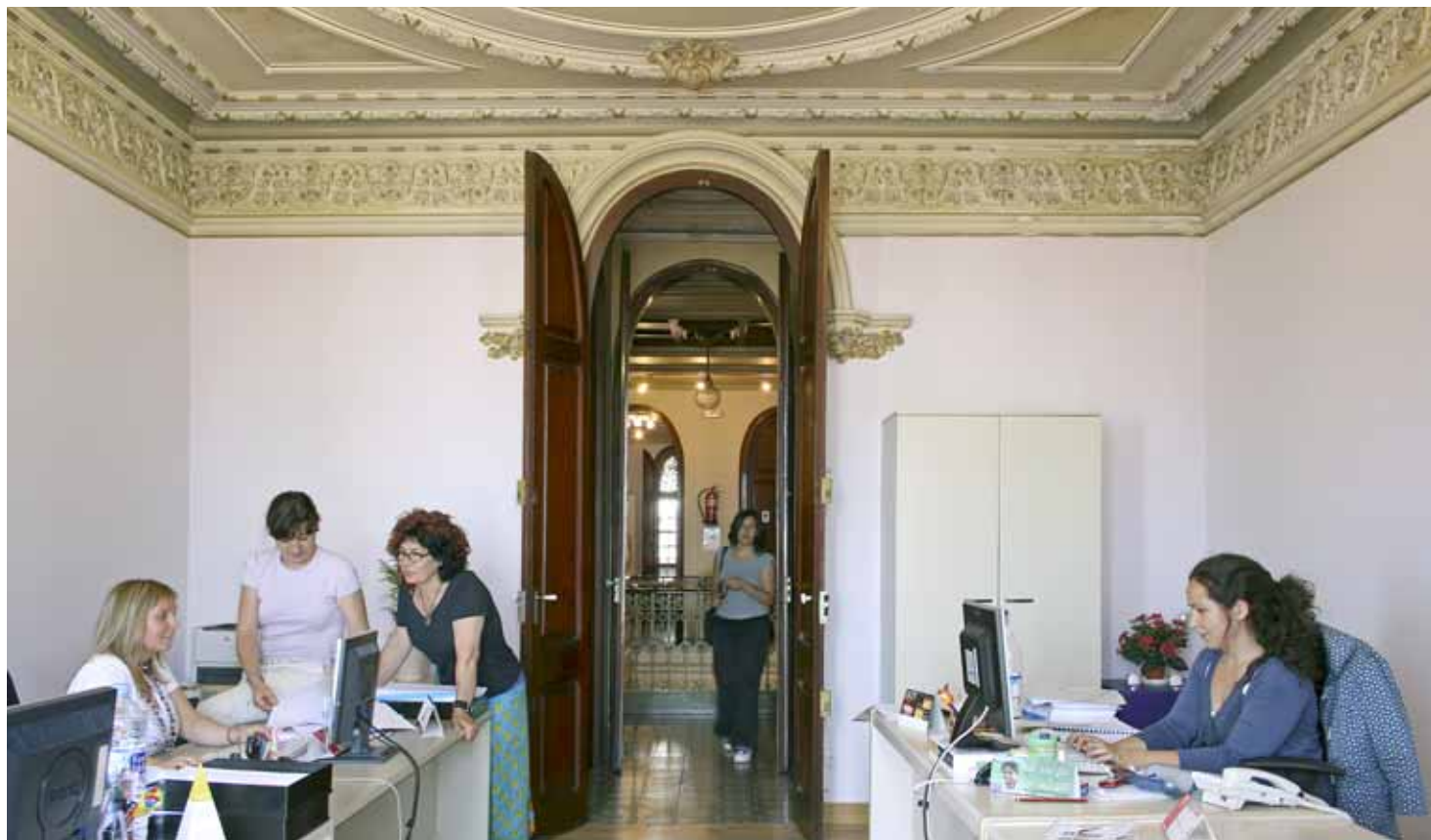
El servei es va inaugurar al mes de març, coincidint amb la celebració del Dia Internacional de la Dona.

per raó de sexe, i potenciar la implicació i la participació activa de les dones en diferents àmbits de la nostra societat. El CIRD ja és un servei de referència per a les dones. Així ho demostren les 87 visites rebudes (entre acollida i seguiment). Com a resultat d'aquestes visites, s'han obert 60 expedients, 21 dels quals s'han pogut tancar en data d'avui després d'haver donat resposta a la demanda plantejada.