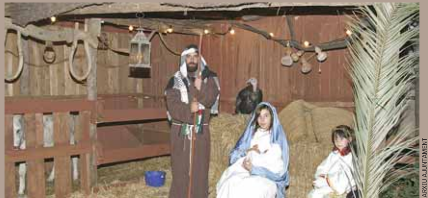
El naixement d'una edició passada del pessebre vivent.

Després de la decisió de no fer el pessebre vivent l'any 2008 i ajornar-lo fins enguany per diversos problemes organitzatius, el pessebre vivent s'instal·larà de nou als jardins de Can Malet, fruit de l'acord entre l'Associació Lúdica Amics Pere Grau, el Casal de la Gent Gran de Can Malet i l'Ajuntament del Masnou. Els aspectes de l'acord inclouen la consideració de l'Equip de Govern que el pessebre vivent és una activitat d'interès cultural local. La ubicació cèntrica i la bellesa natural de l'espai públic dels jardins de Can Malet hi propicien la realització d'una activitat com aquesta.