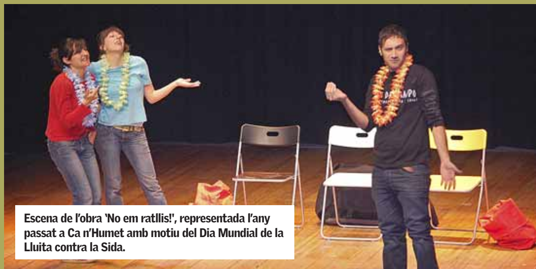
Escena de l'obra 'No em ratllis!', representada l'any passat a Ca n'Humet amb motiu del Dia Mundial de la Lluita contra la Sida.

podran aprendre danses de Bollywood i informar-se de com viure una sexualitat plena i segura. A l'Espai de Trobada, també se'ls informarà de manera més intensiva de la malaltia i de com prevenir-ne el contagi, i podran recollir informació i fullets sobre el tema. ■