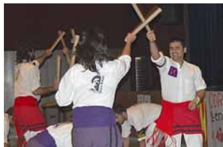
Una de les actuacions al Correllengua.