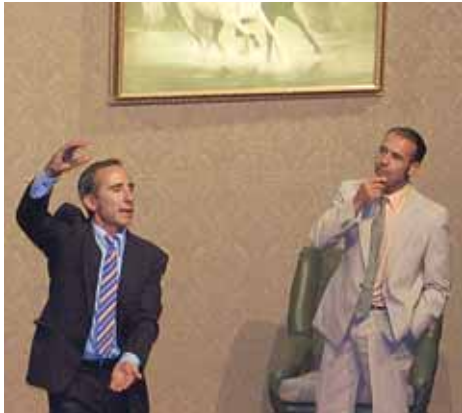
Moment de l'espectacle 'Volare'.

L'espectacle Volare , de la formació Los Dos Los, va ser l'encarregat d'obrir el cicle de la segona edició de festival de teatre Ple de Tardor, el divendres 16 d'octubre, a Ca n'Humet. El cicle va continuar amb l'espectacle Las Gallegas , de la formació Lolita Corina, el 23 d'octubre. En el moment de tancar aquesta edició era prevista l'actuació d' Inventari , de Marcel Gros, el 30 d'octubre, i de Circ-Cabaret Armando Rissotto , de la Companyia Txo Titelles, el 6 de novembre. Com l'any anterior, el Ple de Tardor vol allargar l'esperit del Festival Internacional de Teatre Ple de Riure més enllà de l'estiu. La venda anticipada d'entrades es fa a l'OAC i el mateix dia a taquilla. ■