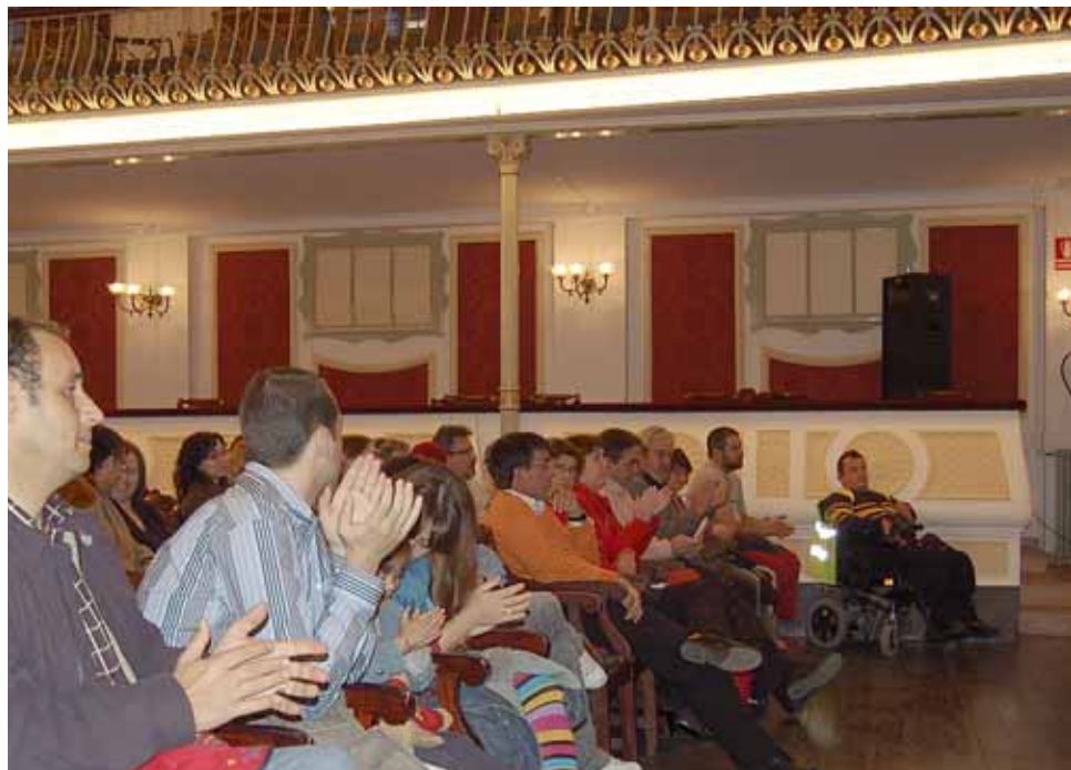
Una de les activitats organitzades per l'entitat.

L'Associació de Discapacitats Físics El Masnou (ADDFEM) és una entitat que va néixer fa quatre anys amb la voluntat de solucionar la problemàtica que pateix la gent amb disminució física al Masnou, tant en la vessant de treballar per la supressió de les barreres arquitectòniques, de transport, d'aparcament i de desplaçaments dins i fora del nostre municipi, com també en la de la integració dels seus associats i associades socialment i en el mercat laboral. Actualment, l'entitat compta amb prop de dues-centes persones que hi col·laboren i que treballen per aconseguir un municipi més adaptat a les necessitats de les persones amb discapacitat. Segons els càlculs d'aquesta associació, actualment hi ha unes 600 persones disminuïdes físiques i mentals al municipi.