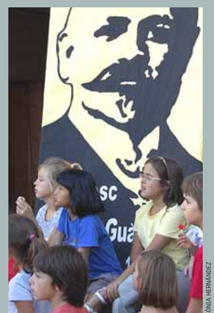
Els escolars van recordar Ferrer i Guàrdia.