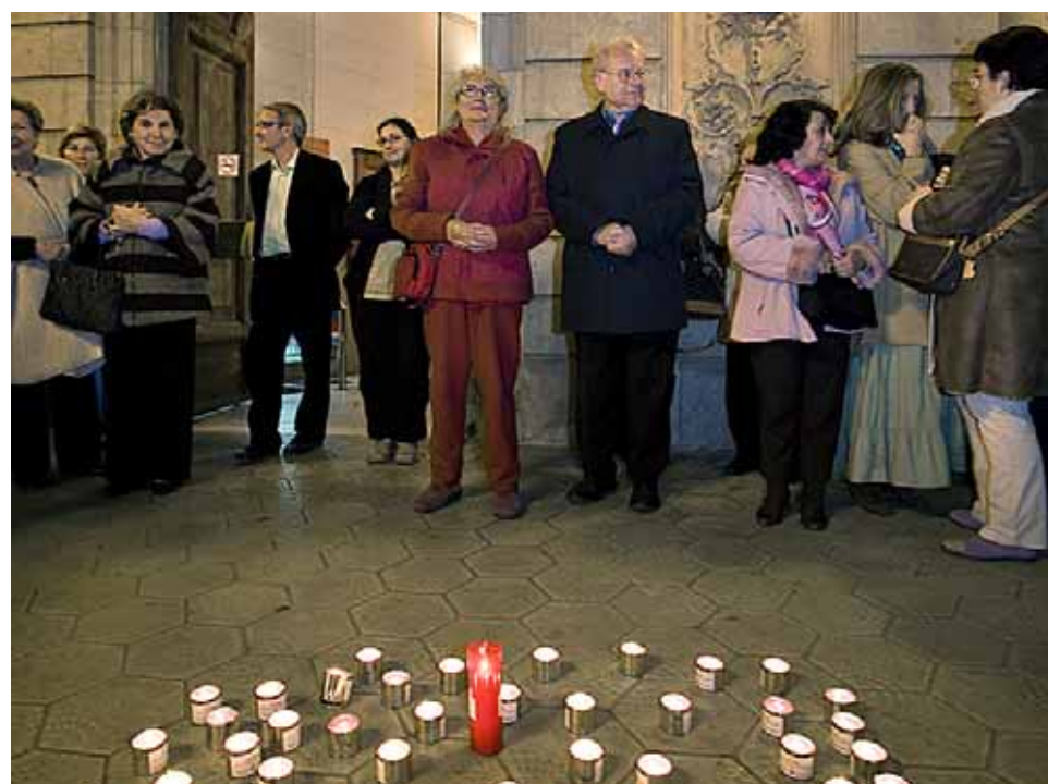
La concentració silenciosa i l'encesa d'espelmes en record de les víctimes de la violència de gènere tornarà a fer-se durant la campanya d'enguany.

Per a la jornada del dissabte 7 de novembre, és prevista una visita a la Maternitat d'Elna (Llenguadoc-Rosselló, França), una activitat organitzada per l'Associació UNES-