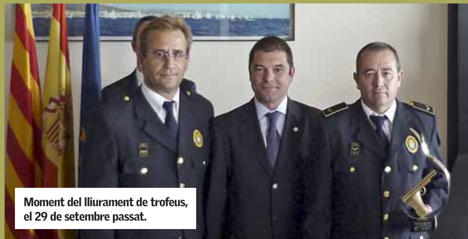
Moment del lliurament de trofeus, el 29 de setembre passat.