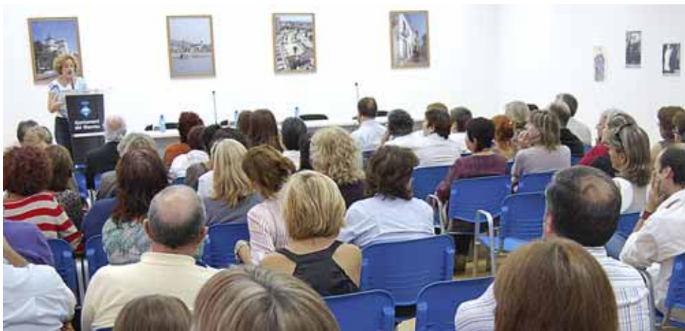
La sala d'actes d'Els Vienesos es va omplir per inaugurar el curs escolar.

El curs 2009-2010 està marcat per novetats destacades