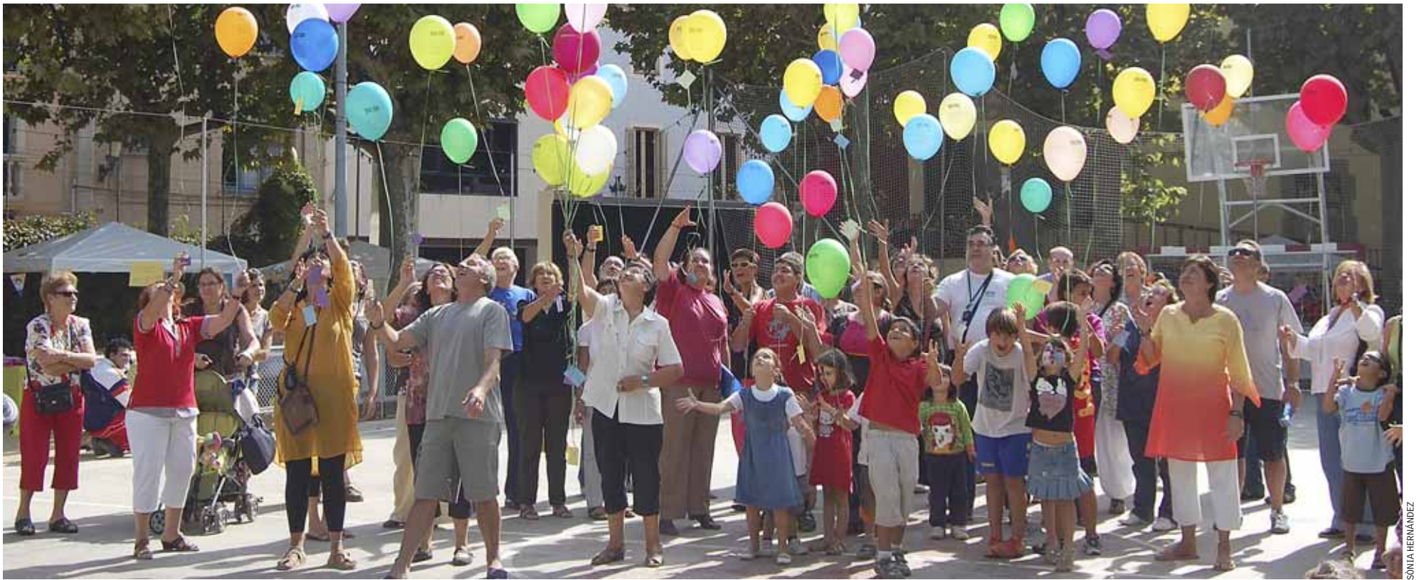
L'enlairament de globus amb desitjos és una tradició a cada edició de la Diada de la Salut Mental d'ESQUIMA.

L'Ajuntament i l'entitat ESQUIMA reben un reconeixement per lluitar contra l'estigma social de les persones que pateixen malalties mentals