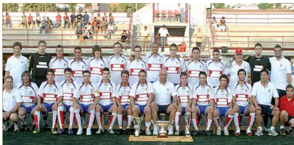
Plantilla del C.D. Masnou.

El Camp Municipal del Masnou va acollir, el diumenge 30 de maig a les 12 del migdia, el partit de Lliga de la Primera Divisió Catalana que va donar l'ascens a la Tercera Divisió Nacional