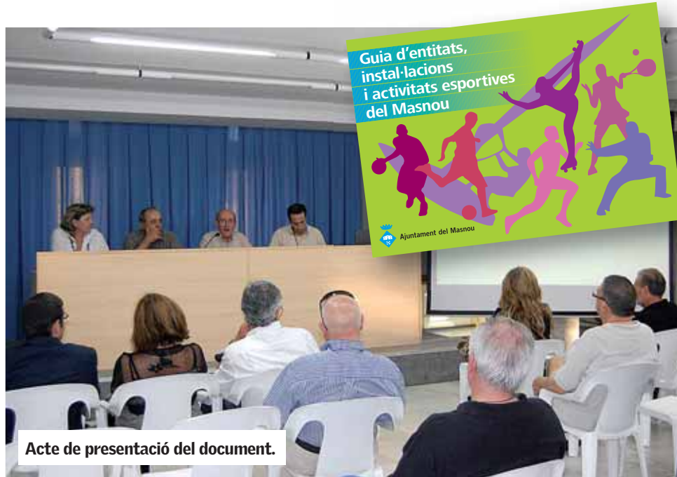
Acte de presentació del document.

El dimarts 8 de juny, a les 20 h, a la segona planta de Can Malet, es va presentar la nova Guia d'entitats, instal·lacions i activitats esportives del Masnou , que ha editat l'Ajuntament, on es poden trobar totes les entitats esportives del municipi, els tipus d'activitats que ofereixen, i els llocs i els espais on es fan les activitats esportives.