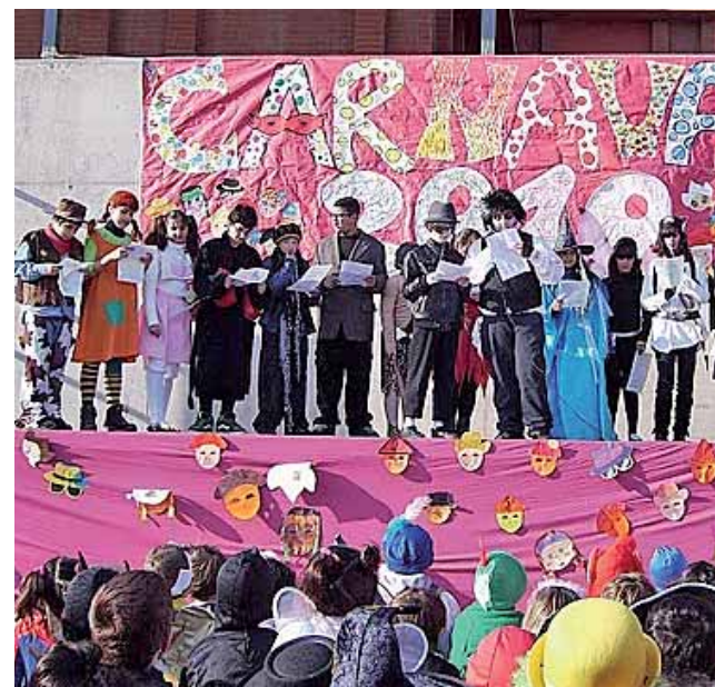
Festa i convivència entre els diferents cursos.