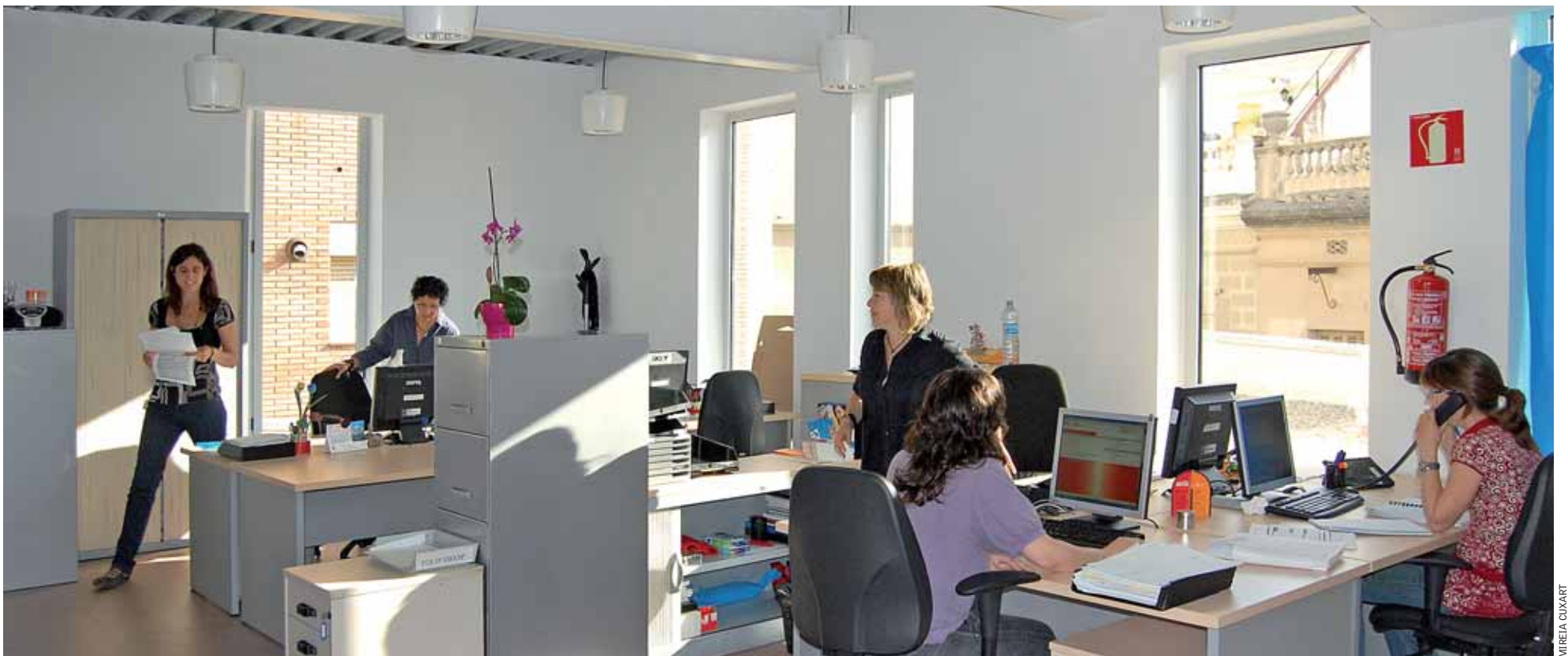
L'oficina de Serveis Socials està ubicada al nou edifici municipal del carrer de Roger de Flor, 23.

A l'Ajuntament del Masnou, aquesta tasca de lluita contra les situacions socials més desfavorides es du a terme des del Servei Bàsic d'Atenció Social (SBAS). Amb un equip tècnic de professionals format per quatre treballadores socials, tres educadores socials, una treballadora familiar responsable de Servei d'Atenció Domiciliària i una coordinadora, té per objecte promoure els mecanismes per conèixer, prevenir i intervenir en persones, famílies i grups socials, especialment si es troben en situació de risc social o d'exclusió. Aquest servei té les oficines ubicades al nou edifici municipal del carrer de Roger de Flor, 23.