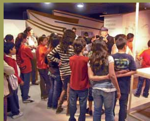
MUSEU MUNICIPAL DE NÀUTICA