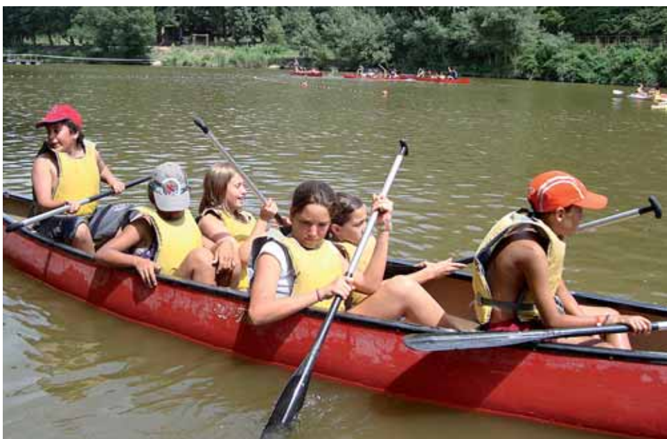
Una de les activitats dutes a terme l'estiu passat dins el Fakaló.

El Fakaló 2010 engloba el Casal d'Estiu i el Campus Esportiu, les activitats d'estiu per a infants i joves del Masnou. El Casal d'Estiu Infantil és per a infants nascuts del 1998 al 2006, i el Campus Esportiu és per a nois i noies nascuts entre el 1994 i el 2000 que, al llarg d'aquest juliol, participaran en un ampli ventall d'activitats.