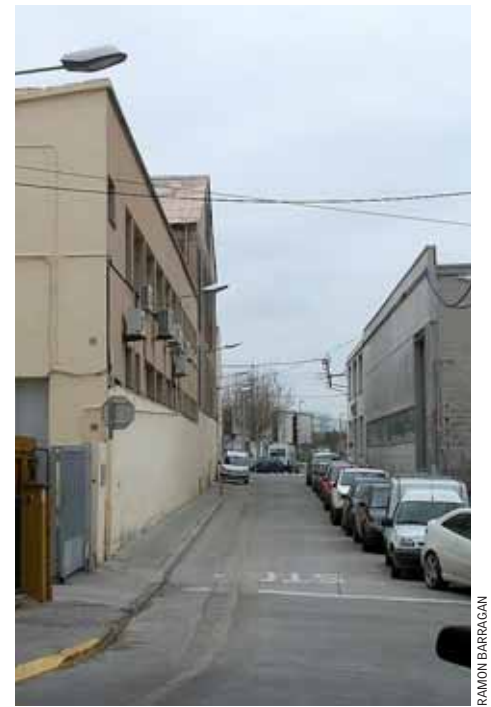
Zona industrial del municipi.

L'Ajuntament està duent a terme un conjunt d'iniciatives per reduir l'impacte del soroll i els seus efectes negatius al municipi. Un dels principals objectius és arribar a la conciliació del descans del veïnatge amb altres activitats també necessàries o reivindicades com l'industrial o l'oci. A més d'haver aprovat inicialment, al Ple del 20 de maig passat, el mapa de capacitat acústica, el consistori prepara una ordenança sobre el soroll, ha encarregat un estudi que ha d'ajudar a determinar els límits acústics que han de respectar les guinguetes de la platja i ha elaborat un protocol per a la regulació de les activitats extraordinàries dels bars de la platja.