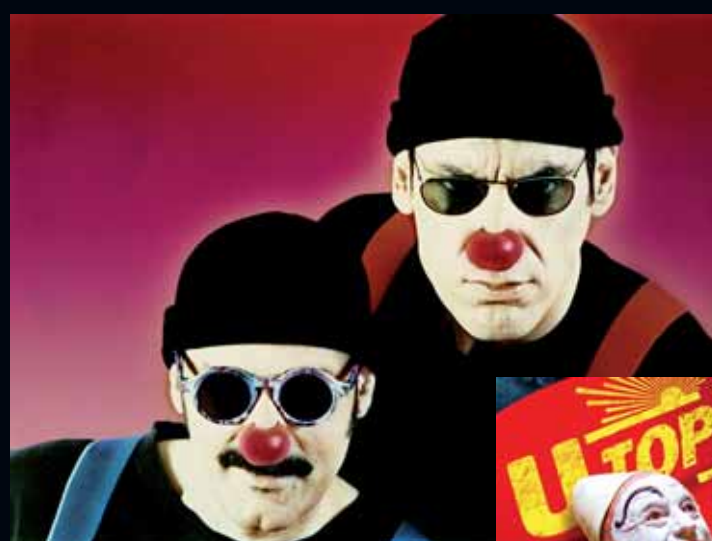
Faemino y Cansado