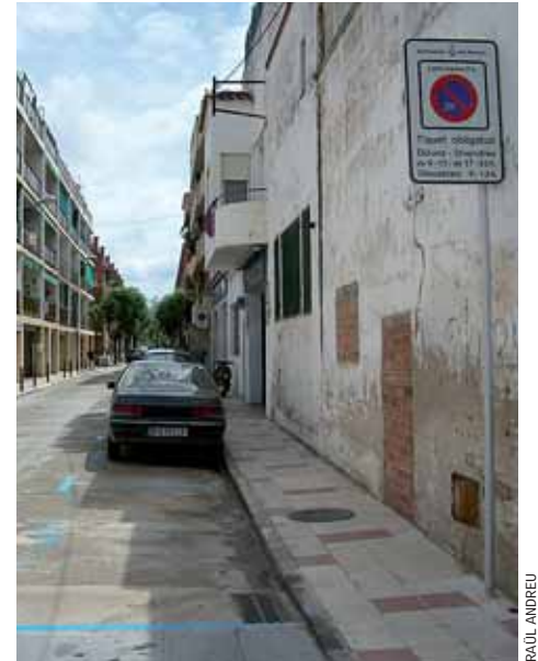
Zona blava al carrer de Puerto Rico.

Des de l'1 de juny, ja estan en funcionament les tres zones taronges del municipi. Es tracta de tres zones de pagament fraccionat, als sectors de Voramar I i II i Can Teixidó, pensades per a la gent forània que als estius es desplaça a les platges del Masnou i Ocata. Com a novetat d'enguany, s'han ampliat en 43 les places incloses dins d'aquestes zones.