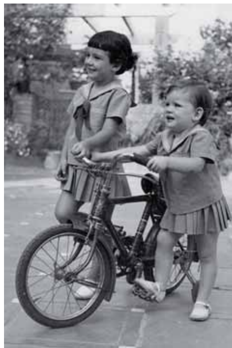
Imatge de la mostra 'Fem història'.

El Museu Municipal de Nàutica, amb motiu de la Festa Major de Sant Pere 2010, ofereix diferents activitats gratuïtes