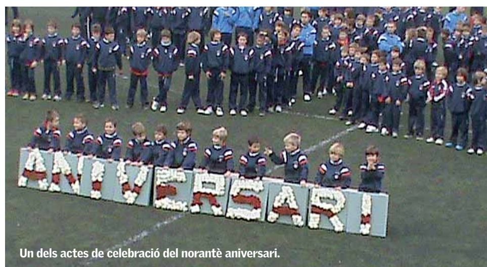
Un dels actes de celebració del norantè aniversari.

al C. D. Masnou, que torna a la Tercera Divisió després de la victòria per 1-0 contra el C. D. Tortosa, que va donar els tres punts necessaris per assolir l'ascens. ■