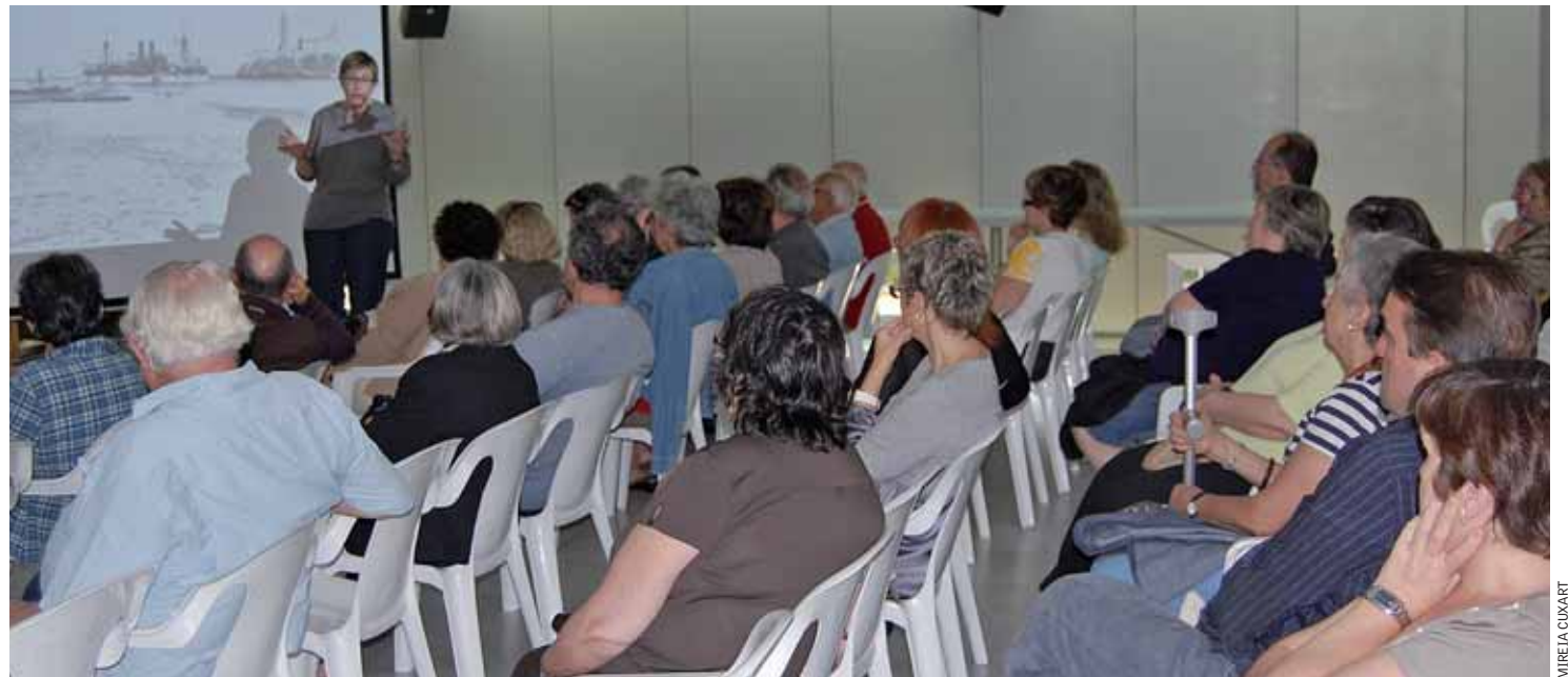
A cada xerrada, hi han assistit una cinquantena de persones.

El 15 de juny, va ser el torn de la conferència "Els indians: negrers i comerciants