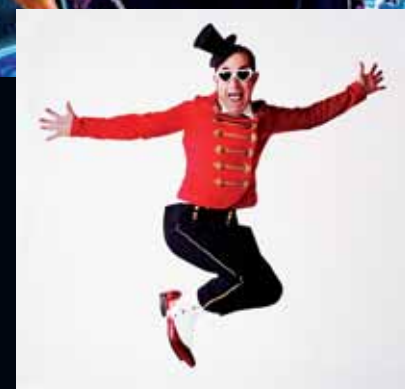
La Industrial Teatrera

El dia 20 de juliol inauguraran el festival Tandarica Orkestar , a les 12 h, al mercat setmanal, per marcar el tret de sortida al reguitzell d'actuacions gratuïtes que hi tindran cabuda: els argentins Los Estrambóticos , amb l'espectacle de teatre, circ, màgia i molt d'humor Kataplum ; els catalans Mumusis Circus , amb Merci bien , que oferiran un espectacle fresc, divertit i efervescent de música i acrobàcia; els també catalans Tukitrek , que portaran Hôtel Crab , un espectacle de titelles sense paraules, amb un llenguatge teatral molt proper al cine mut, i la companyia nord-americana The Roping Fool , amb Leapin' Louie .