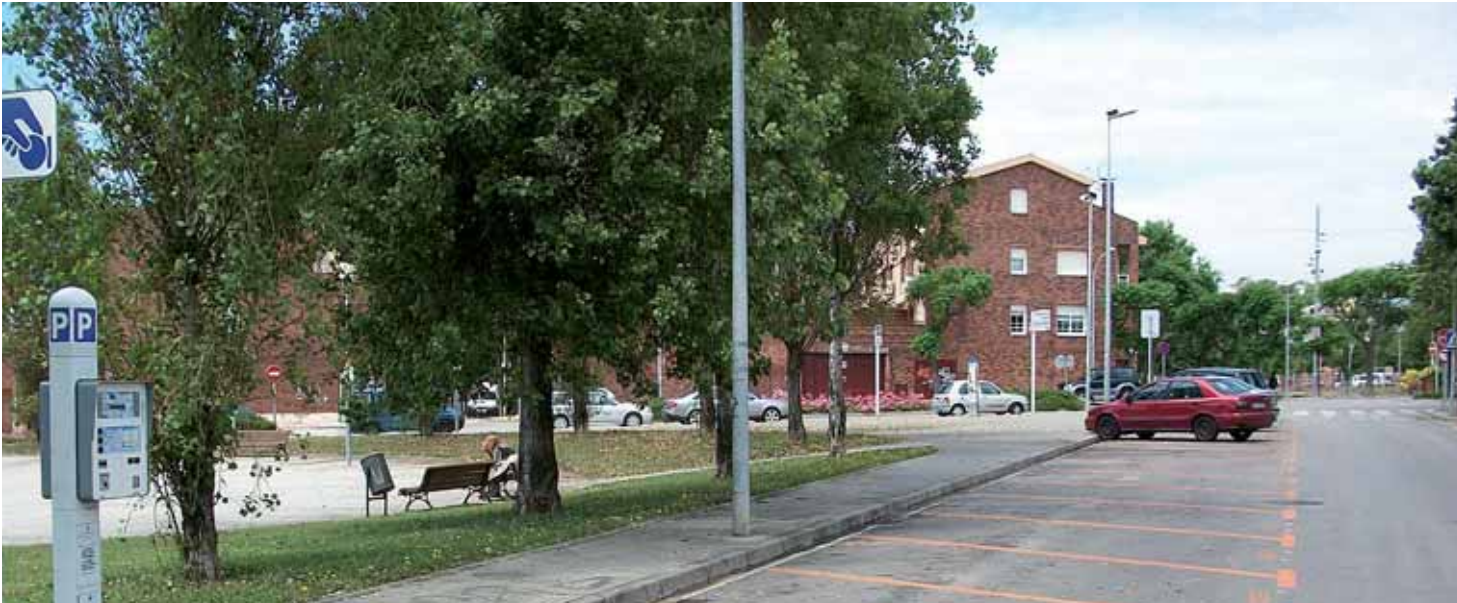
Algunes de les noves zones taronges que hi han entrat en funcionament.

La iniciativa vol promoure la rotació de vehicles de persones que han de fer gestions i visites als comerços