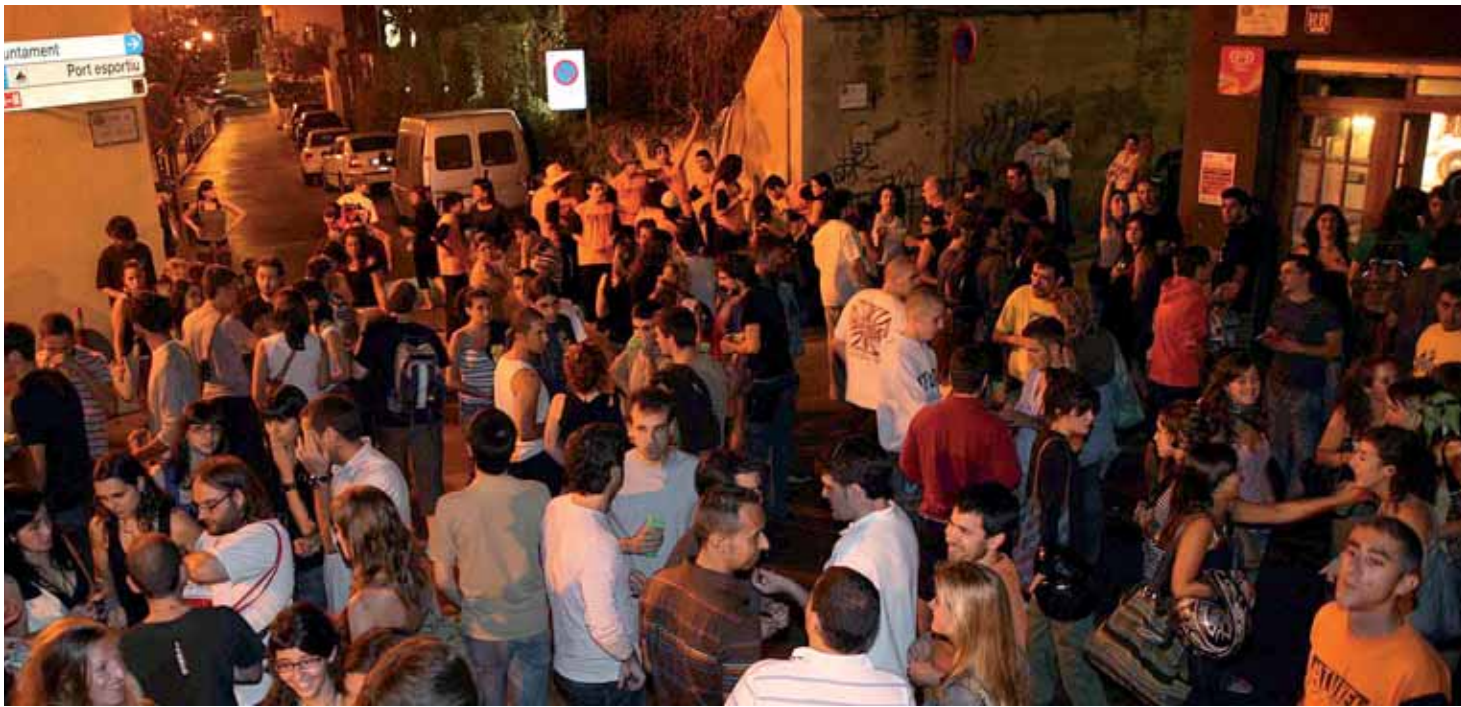
Els actes festius de l'estiu, al carrer o a la platja, suposen un dels problemes principals de convivència.

L'Ajuntament aprova el mapa de capacitat acústica i està treballant en una ordenança de soroll, a més d'elaborar un protocol per a la regulació de les activitats extraordinàries de les guinguetes