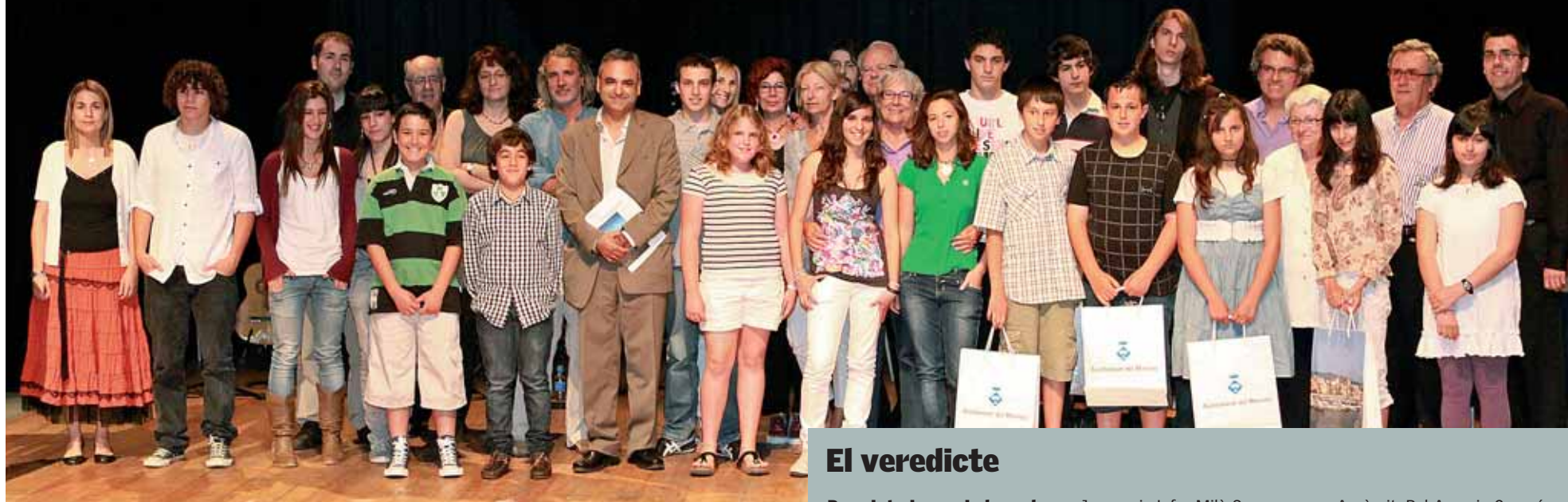
Imatge de les persones guardonades i membres del jurat.