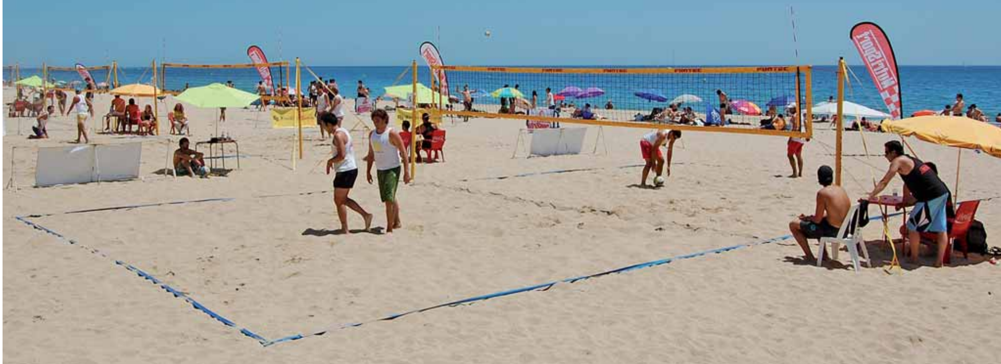
TORNEIG FRANKFURT PARERA

La platja d'Ocata va ser l'escenari de la competició.