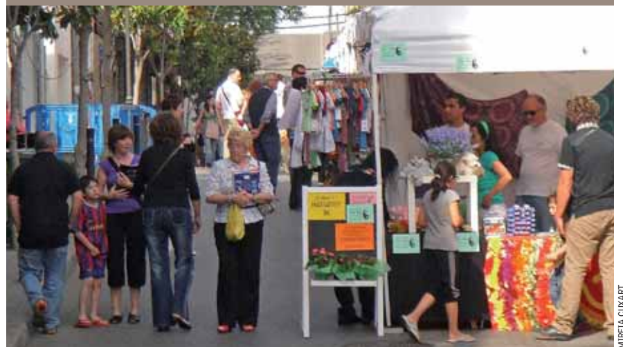
La Fira va comptar amb una bona assistència de públic.

Al llarg del diumenge 30 de maig, la plaça de Marcel·lina de Monteys i els carrers de Sant Miquel i Roman Fabra van acollir l'XI Fira Comercial i Gastronòmica, organitzada per la Federació del Comerç, la Indústria i el Turisme del Masnou, amb la col·laboració de l'Ajuntament. Durant tota la jornada, els comerços i els establiments de restauració de la vila hi van oferir els seus productes i les seves novetats. S'hi van instal·lar una cinquantena de paradetes amb una gran varietat d'expositors, amb venda d'articles