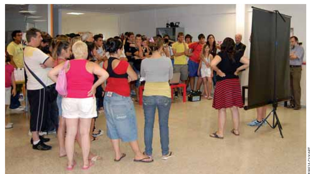
Presentació d'un projecte dels joves del Centre Obert Maricel, al juliol passat.