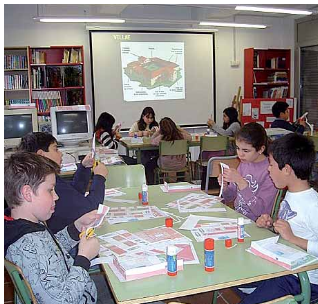
Una de les aules durant una activitat.

Plaça de Ramón y Cajal, 11 Telèfon: 93 555 86 03 a8038031@xtec.cat