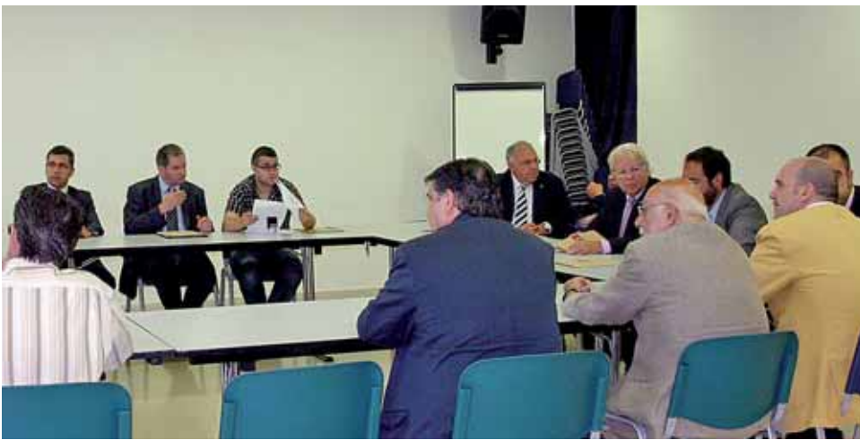
Reunió d'alcaldes i representants dels municipis que formen part de la DO Alella.

L'organisme vol impulsar l'activitat turística i econòmica dels municipis que en formen part