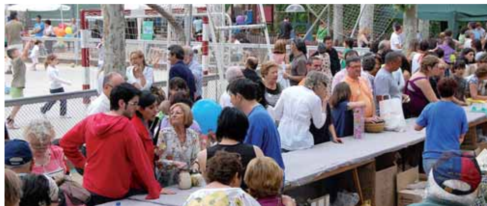
La bona acceptació del Festival es fa evident cada any.

El diumenge del 6 de juny, el pati del Casinó va acollir, malgrat els moments de pluja, el Festival Prodisminuïts Psíquics del Masnou, que com cada any celebra l'entitat DISMA per tal d'unir el poble a favor de les persones amb alguna disminució psíquica del Masnou. El Festival va comptar amb la