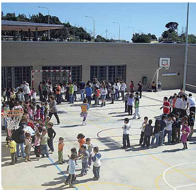
El pati del centre.