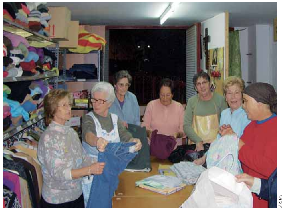
Membres de Càritas gestionant la recollida de roba.

inmediates, com l'alimentació o la higiene, a més de cobrir situacions d'urgència (quan no es pot fer front als pagaments dels subministraments d'aigua, llum, lloguer, hipoteca, desplaçaments, etc.). També hi ha la possibilitat d'atorgar beques per als llibres o per a les activitats extraescolars (casal d'estiu, colònies...) per contribuir a un desenvolupament satisfactori dels infants i escolars. A més, l'SBAS també gestiona prestacions econòmiques d'aquest tipus que ofereixen altres administracions.