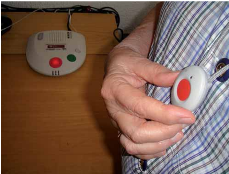
Una usuària amb el penjoll del servei de teleassistència.