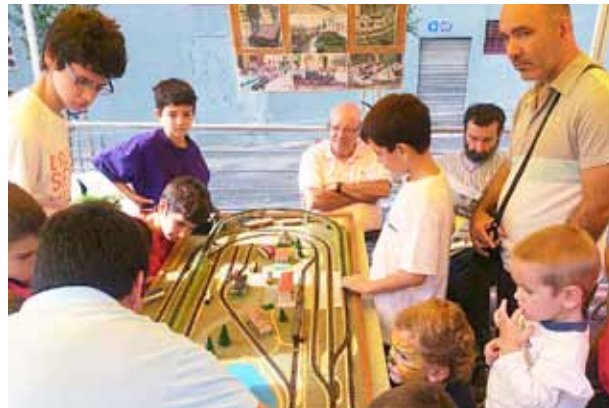
Totes les entitats van tenir un paper cabdal al llarg de la jornada.

Al migdia, per fer una pausa i agafar forces, es va fer una paellada popular a càrrec de la Colla de Diablers i hi van menjar més de seixanta persones.