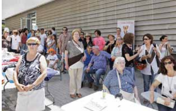
La Jornada d'Entitats sempre compta amb una bona resposta de públic.

Un aspecte que les entitats i col·lectius havien reclamat abans de l'aprovació del Pla de Participació era la millora dels canals de comunicació amb l'Ajuntament. En aquest sentit, a més d'unificar l'atenció a les entitats a la Regidoria de Participació Ciutadana per reduir la multiplicitat de gestions i d'interlocutors, s'han reforçat els mitjans de comunicació que l'Ajuntament posa a disposició de la ciutadania. D'una banda, es va redissenar l'espai d'entitats a la pàgina web municipal, amb la intenció de millorar el servei perquè les associacions poguessin gaudir d'un espai web propi. A més a més, ha entrat en funcionament el portal de notícies www.elmasnouviu.cat , on les entitats poden adreçar les seves informacions per tal que siguin publicades i puguin informar el públic en general