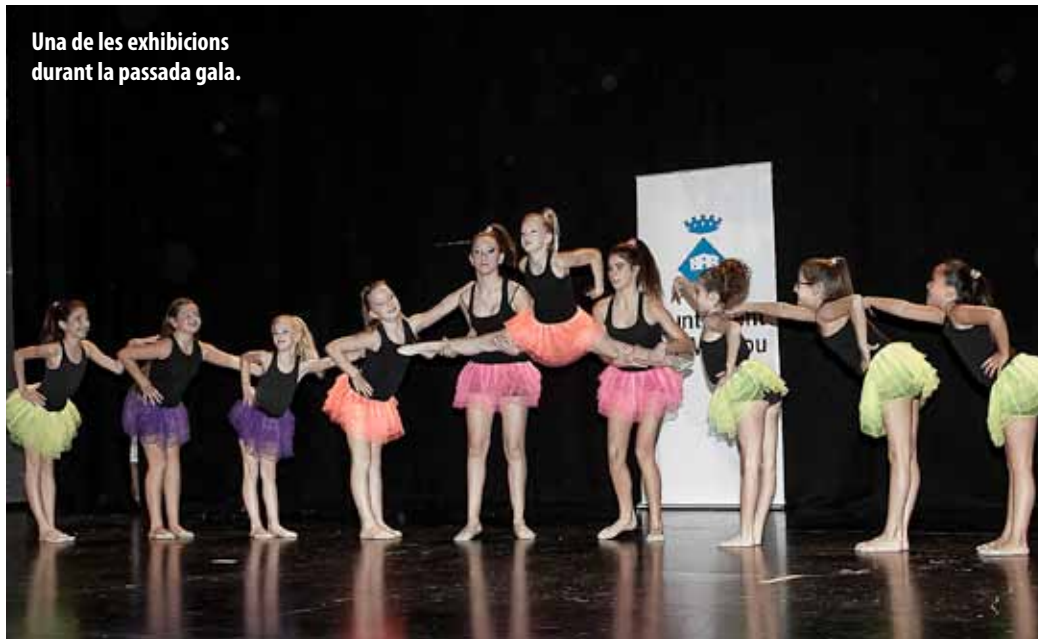
Una de les exhibicions durant la passada gala.

Es reconeixerà el millor esportista que competeixi amb una entitat fora del Masnou