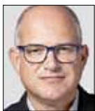
Ernest Suñé Regidor del Grup Municipal del PSC