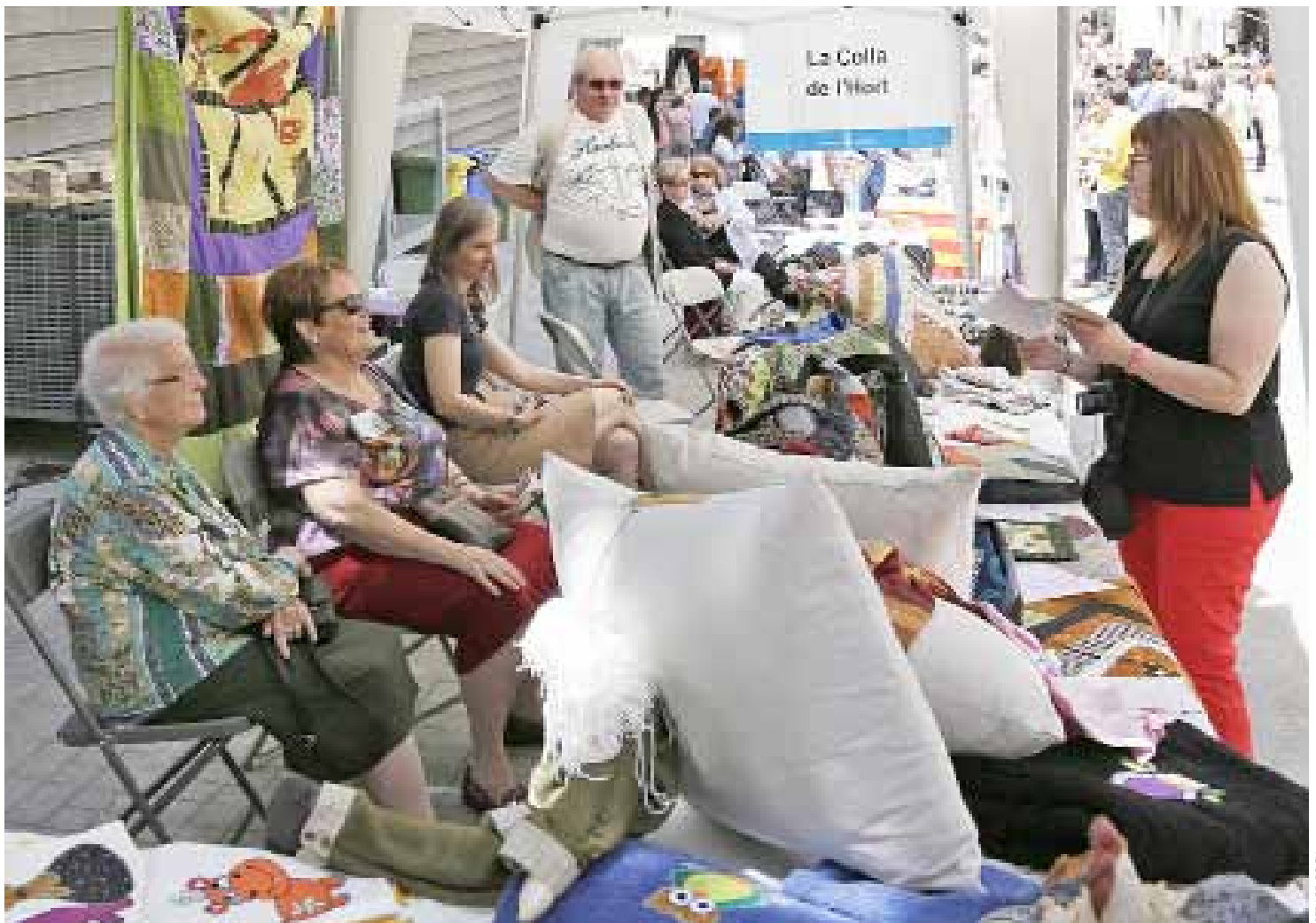
A la Jornada d'Entitats, cada associació mostra la seva tasca.

L'enfortiment de la xarxa d'entitats i la reordenació dels equipaments, entre els èxits més destacats