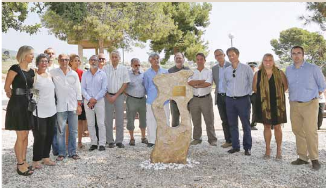
Els regidors i regidores amb la placa i el monòlit que commemora el Tricentenari, que es va descobrir el dia de la Diada.