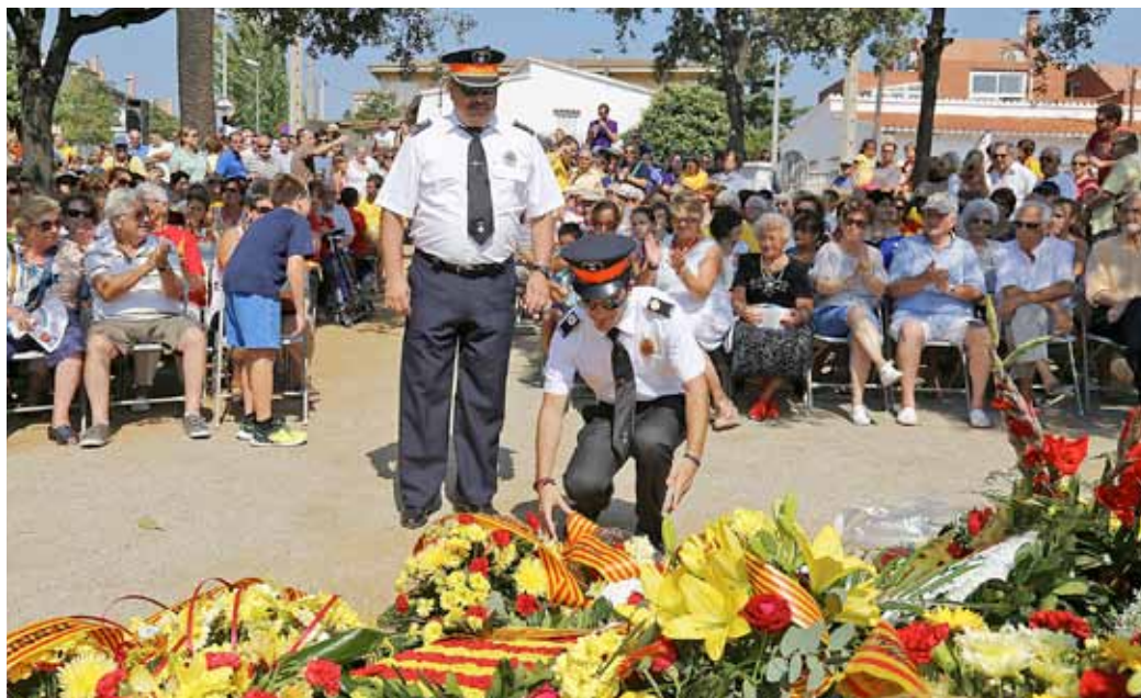
Dos membres de Protecció Civil dipositen les flors durant l'ofrena a la plaça de l'Onze de Setembre.

Després de l'ofrena floral, la Coral Xabec de Gent del Masnou va interpretar El cant dels segadors , al qual es van afegir els assistents a l'acte, que omplien la plaça de l'Onze de Setembre. A continuació,