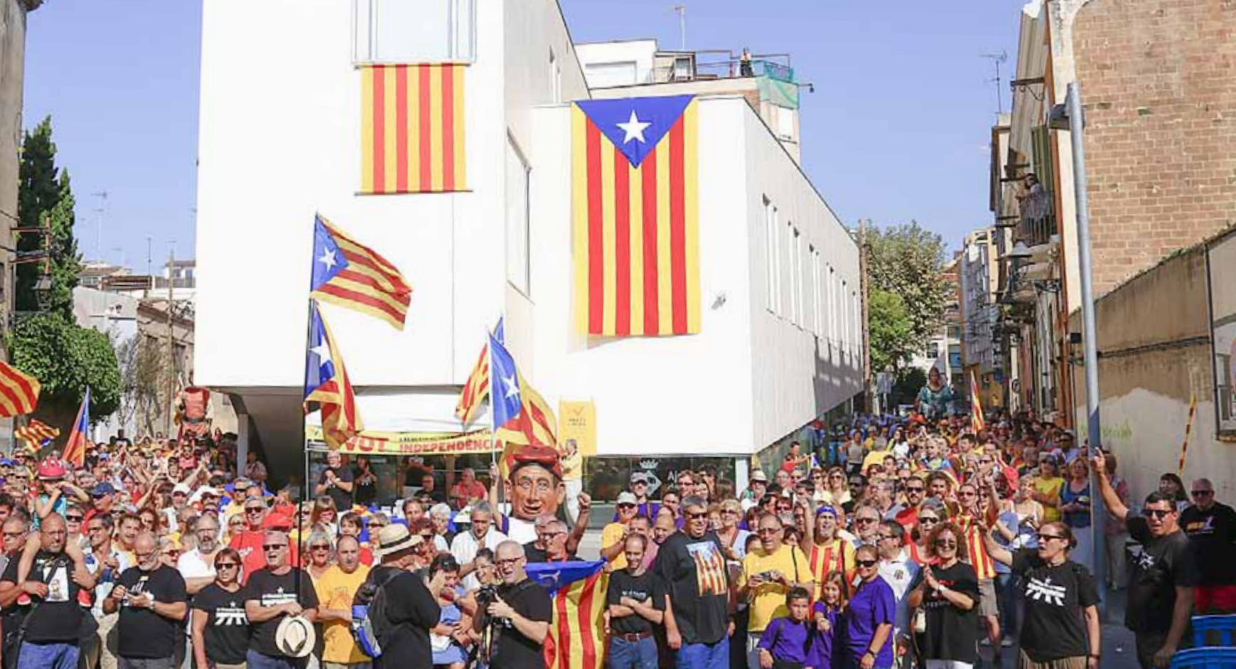
La mobilització per fer la V masnovina va ser promoguda per l'entitat Assemblea Nacional Catalana.