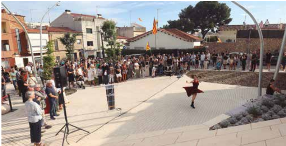
▲ L'acte va servir perquè la ciutadania conegués aquest nou espai públic, que commemora els fets de l'1 d'octubre de 2017 al Masnou.