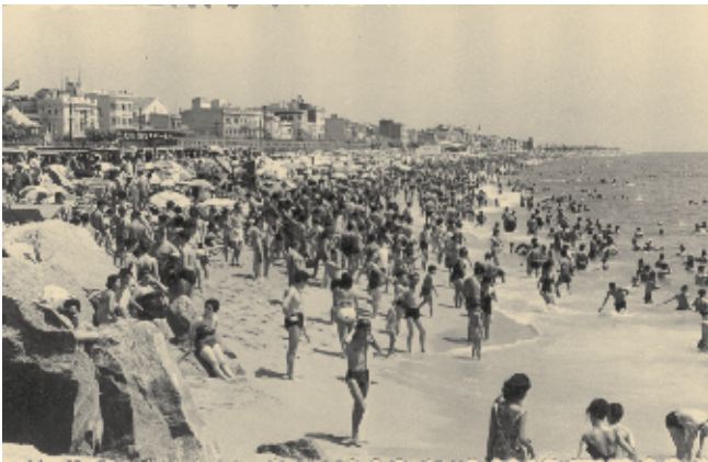
Platja d'Ocata atapeïda de banyistes, el 15 de juliol de 1962.