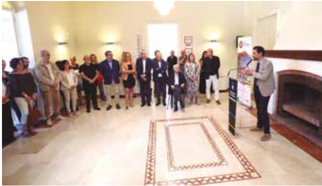
▲ La celebració va comptar amb la participació de Roger Torrent, conseller d'Empresa i Treball en funcions.

Durant aquesta dècada ha servit de trampolí per a un gran nombre de projectes empresarials