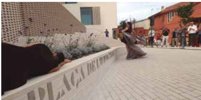
▲ Dues ballarines van fer una original descoberta de les lletres que donen nom a la plaça mentre dansaven.