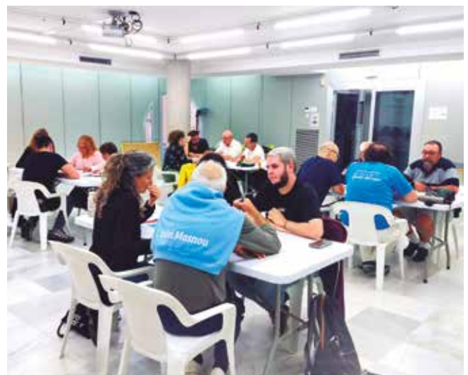
▲ Prop de trenta masnovins van participar en les jornades de prioritització.