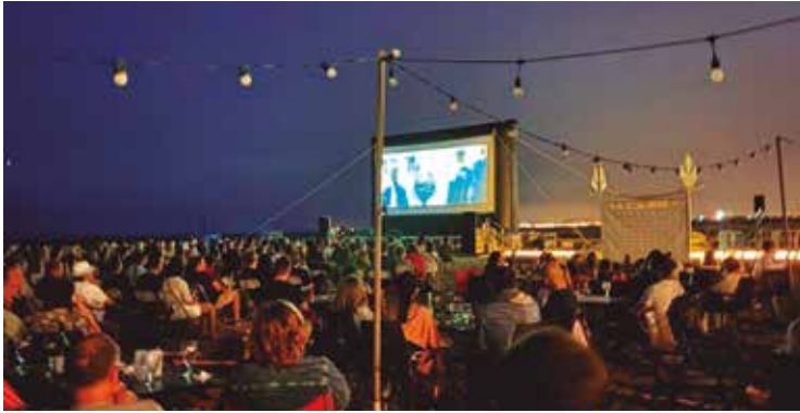
▲ La fidelitat del públic que visita aquest Festival omple la platja cada edició. FASCURT

El 22è Festival de Curtmetratges del Masnou també ha estat marcat per la gran qualitat de les obres presentades