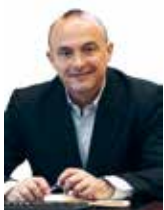
Jaume Oliveras Alcalde

Immersos en ple estiu, aquest mes de juliol ens porta molta activitat festiva, però també canvis importants al municipi. Les pluges han reduït les mesures contra la sequera, però això no treu que no hàgim de continuar aplicant algunes restriccions i mesures per combatre-la.