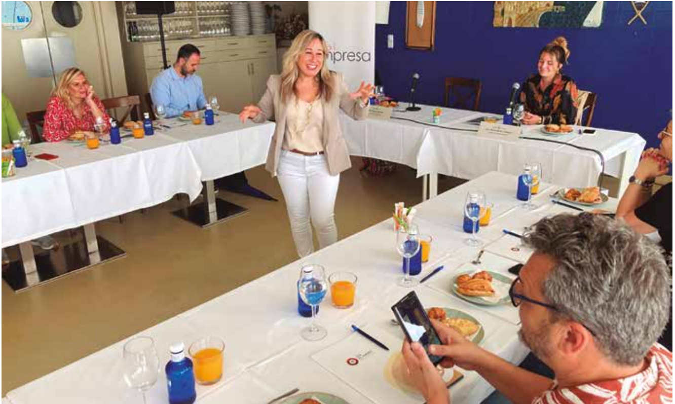
▲ La ponència de Mendoza es va centrar en la intel·ligència emocional aplicada a l'estratègia comercial. DOMÈNEC CANO

La conferenciant, especialitzada en estratègia comercial, participa en les jornades Cafè i Empresa